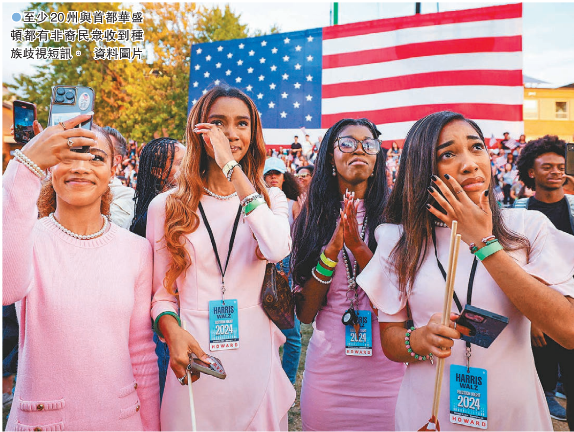
至少20州與首都華盛頓都有非裔民眾收到種族歧視短訊。資料圖片

據美聯社等媒體報道，這些短訊是從大選週日的周三(11月6日)開始出現，至少20州與首都華盛頓都有非裔民眾收到。這些短訊內容大同小異，大多數是告訴收件者他們「被選為採摘棉花工人」或「要成為奴隸」。所有短訊中都要求收件者在特定日期和時間「準備好」，屆時會有白色SUV汽車來接他們到種植場。有些短訊還註明收件者的姓名或所在位置，部分甚至提及特朗普。