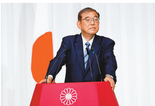
●日本執政聯盟未能在眾院大選維持過半議席，首相石破茂相位受到反對派陣營挑戰。資料圖片

此外，眾院各常設委員會擁有17位常任委員長，在近日舉行的朝野各黨派協商會議上，亦對席次分配進行洗牌，確定執政黨拿到10席、在野黨獲7席，而在眾院選舉前，僅自民黨便掌握13席。自民黨決定放棄負責審議預算案的預算委員長這一重要職位，以換取自民黨與公明黨聯合政府繼續執政。《讀賣新聞》報道，在野黨在要求委員長席次方面團結一致，儘管自民黨以強硬姿態出席談判，但最後不得不作出大幅讓步，自民黨官員坦言，這是「從一