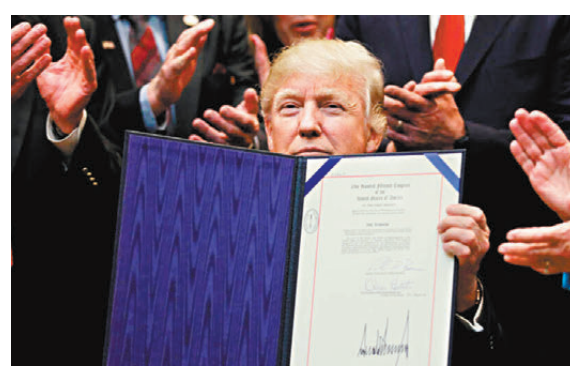
●特朗普在首個總統任期時屢次頒政令強推政策。

報中所列的許多行動，都是特朗普早前作出的競選承諾。特朗普交接團隊發言人萊維特表示，今次大選結果等於是「授權特朗普兌現競選期間所作出的承諾，他將會兌現」。