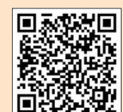
香港鶴山同鄉會網址