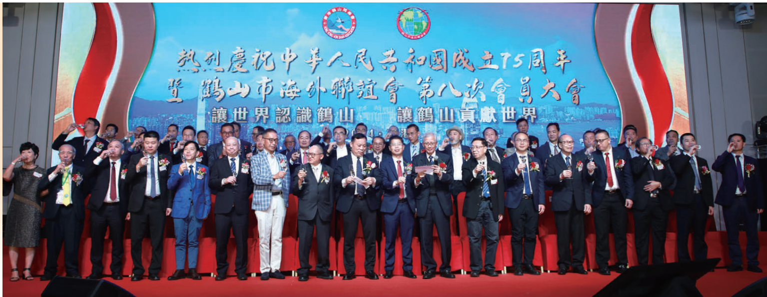
▲台上嘉賓向出席的僑團和同鄉友會祝酒。

於11月4日至6日，香港鶴山同鄉會成功舉辦了三年一度的「鶴山市海外聯誼會」（下稱「世鶴2024」）。本次盛大的聯誼會吸引了來自世界各地的鶴山僑領及同鄉，逾800名各界來賓齊聚一堂，共話深情，共謀發展。