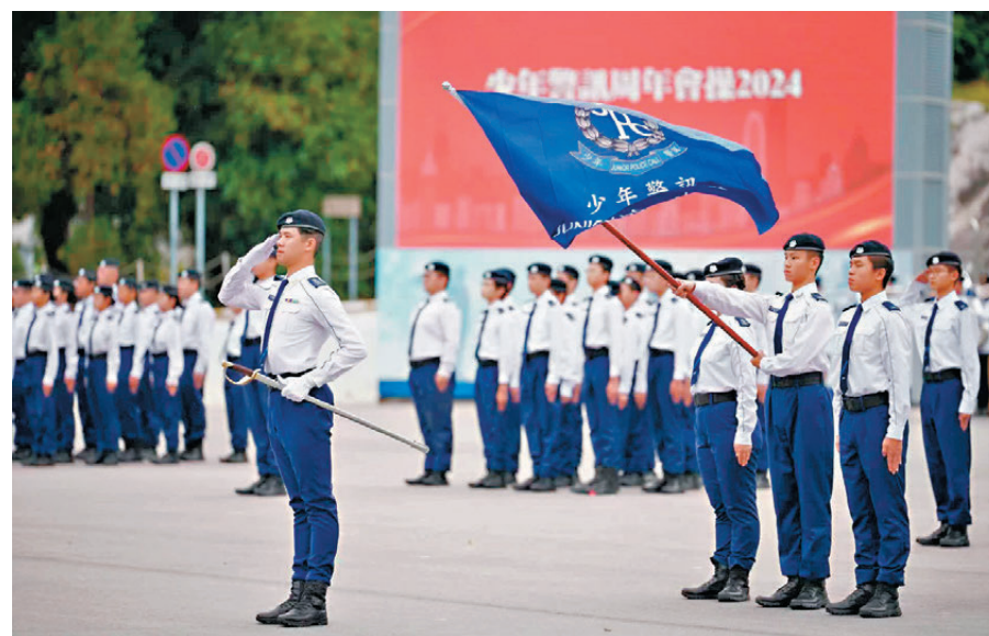
●少年警訊周年會操。

自2022年起，少訊安排義務步操教官到中小學教授學生升旗禮儀、國歌、列隊、步操動作口令及懸掛國旗的技巧，培養學員增強國民身份認同及民族自豪感，同時培養團隊精神和鍛煉體魄。