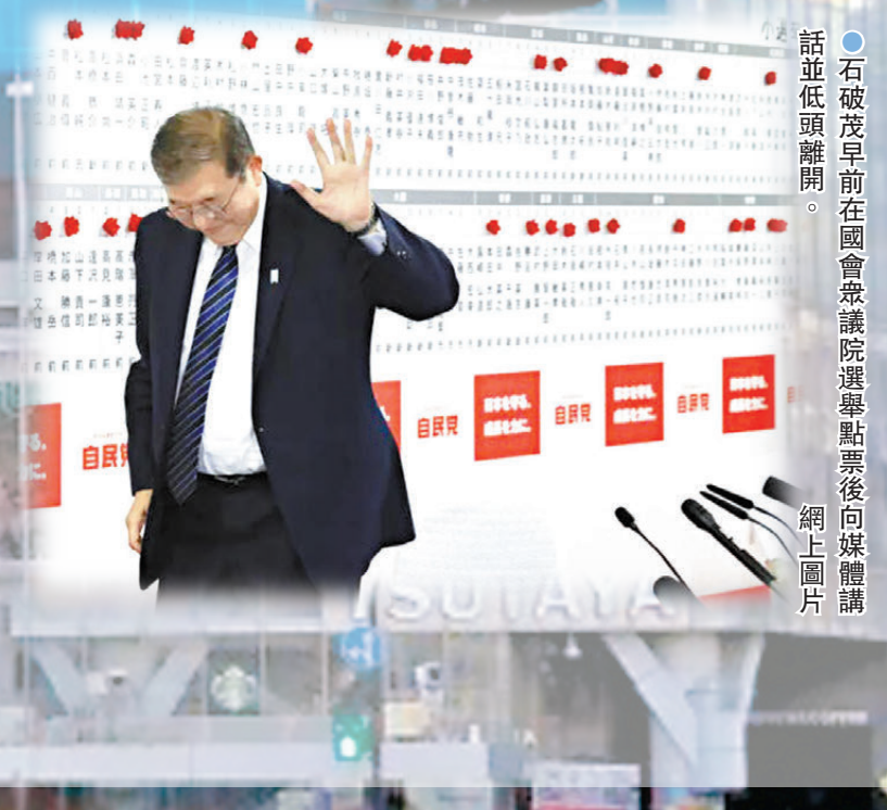
石破茂早前在國會眾議院選舉點票後向媒體講話並低頭離開。

香港文匯報訊 日本周一(11月11日)起召開為期4天的特別國會，首天會議選出新首相。執政自民黨與盟友公明黨在早前的眾議院選舉中慘敗，失去過半數議席優勢。日本放送協會(NHK)指出，多個在野黨均就改革政治獻金法案、調整稅收門檻等議題，施壓自民黨改革。即使首相石破茂有望因在野黨內鬥，勉強以少數派政府形式保住相位，其施政也將受到極大掣肘，甚至不排除在短時間內下台。