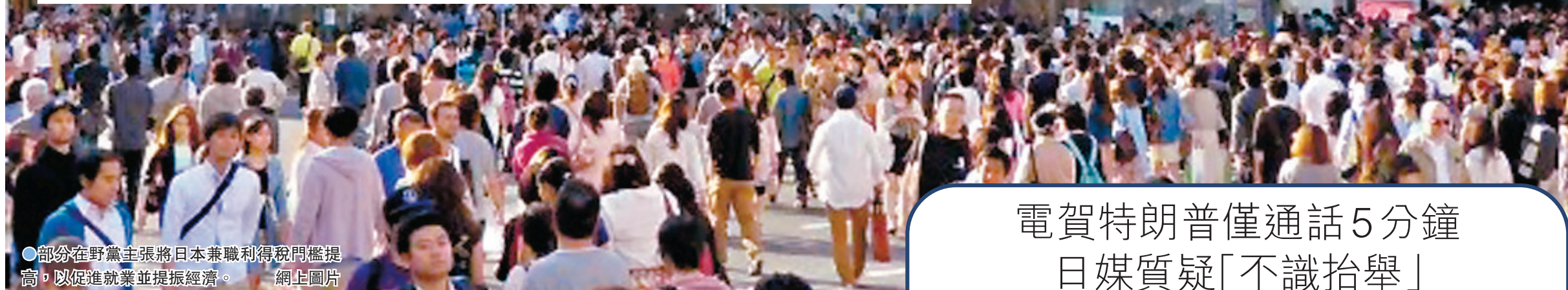
部分在野黨主張將日本兼職利得稅門檻提高，以促進就業並提振經濟。

日本首相指名選舉分為兩部分，首輪若無人得票過半數，得票前兩名者將進入次輪投票，屆時候選人只需取得相對多數即可獲勝。分析普遍預計今次將是日本在二戰後，第5次需以次輪投票選出首相。石破茂與最大在野黨立憲民主黨代表野田佳彥，有望進入次輪投票，由於在野黨勢力分散、難以集中為野田拉票，石破有望勉強守住相位。