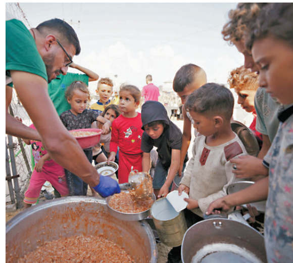
流離失所的巴童在加沙一個營地排隊領取食物。

美國總統拜登政府上月15日曾警告稱，以色列必須在30天內改善對加沙的人道援助情況，否則美國可能扣起軍援。下周三即是美方提出的期限，但加沙當地救援部門稱，以軍周日再度襲擊加沙北部，造成30人死亡，包括13名兒童。黎巴嫩衛生部表示，以軍周日襲擊首都貝魯特北部，造成至少20人死亡，包括3名兒童。