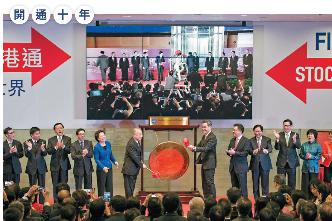
●2014年11月17日，滬港通啓動儀式在香港交易所舉行，代表內地與香港資本市場互聯互通機制正式通車。圖為當年啓動儀式上敲鑼情況。

香港與內地資本市場的互聯互通機制，迎來開通十周年。 港交所昨發布《內地與香港資本市場互聯互通十周年白皮書》，回顧過去十年互聯互通機制的發展歷程，十年間滬深港通僅以約1.2萬億元（人民幣，下同）跨境資金流動淨額，支撐了約177萬億元跨境交易規模，大幅提升跨境資本流動的效率，對發揮香港「背靠祖國、聯通世界」的核心優勢，提升香港資本市場的活力和韌性、鞏固香港國際金融中心地位起到了十分關鍵的作用。港交所預告，互聯互通未來有4大發展方向，包括：將房託基金（REITs）納入滬深港通，讓兩地投資者參與對方市場融資融券安排等等。 ●香港文匯報記者 蔡競文