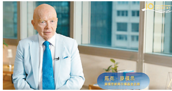
●麥樸思分享對滬深港通看法。

香港文匯報有「新興市場教父」之稱的知名基金經理麥樸思（Mark Mobius），一直熱衷投資中國市場，在港交所慶祝互聯互通十周年的訪問中，他表示，滬深港通的優勢是擴闊了海外投資者的投資範圍，更重要的是大大提升了中國市場的深度。他認為滬深港通的成功，是有目共睹的。