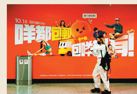
●內地電商今年加強香港市場宣傳攻勢。圖為港鐵站的電商廣告。

他指出，內地電商平台看重香港市場，香港是「出海」發展的首選，隨後再拓展東南亞、中東及「一帶一路」沿線國家市場。這也要求香港商家識變、應變、求變，在轉型中尋求機遇。新一份施政報告提出，向「BUD專項基金」注資10億元，擴大「電商易」地域資助範圍至東盟十國，這表明特區政府支持開拓電商市場，鼓勵中小型企業轉型升級。