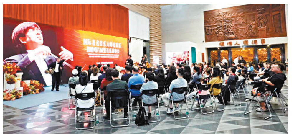
● 國際知名指揮家麥家樂捐贈儀式之後，麥家樂指揮順德本地室內樂團在順德博物館二樓大廳舉辦了音樂會。