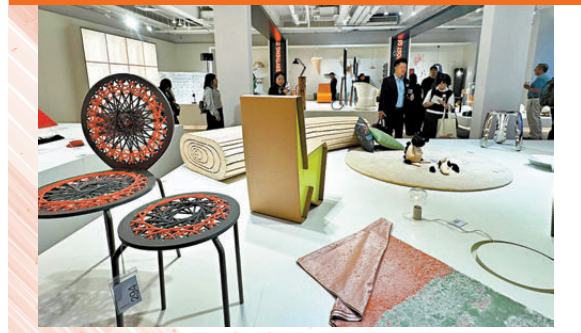
● 衛星展現場吸引不少參觀者到場。

▼ 作品均運用了多種富有可能性的媒材，包括木材、玻璃、金屬、紡織品、軟木和尖端樹脂等。