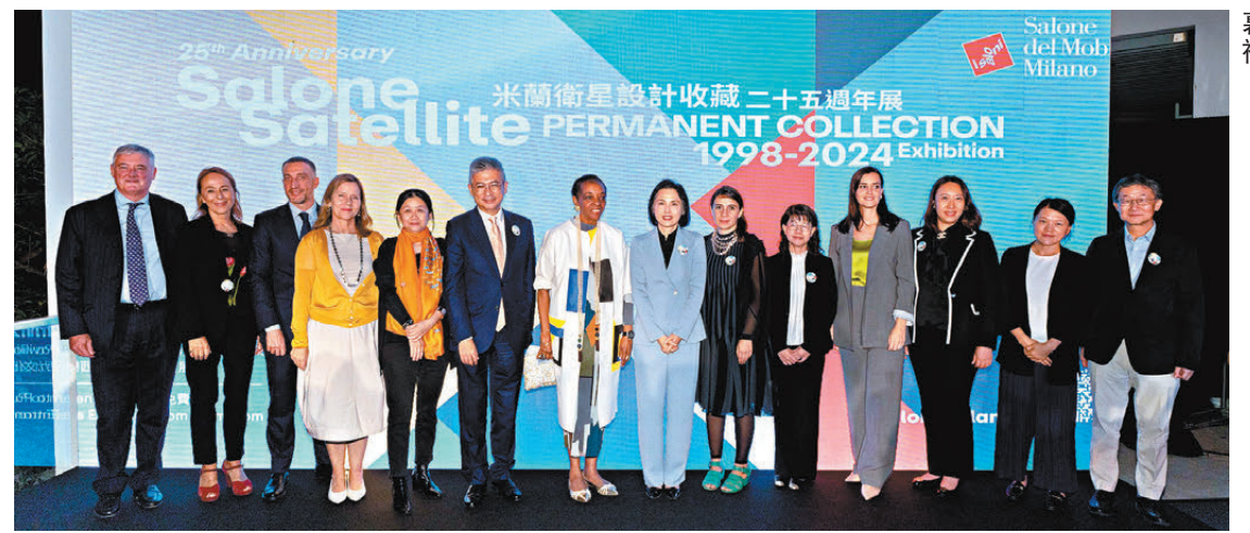
▲ 「米蘭衛星設計收藏二十五周年展」開幕禮。

米蘭衛星展永久收藏，位於意大利布里安科的塞維索河畔倫塔特的阿特伍德學院 (Artwood Academy) 的 ITS Rosario Messina 基金會木製傢具中心，而今次「米蘭衛星設計收藏二十五周年展」則讓觀眾一窺全新衛星設計收藏的風采。自 1998 年創辦以來，衛星展已成為 20 世紀末至今設計趨勢演變的重要資料庫和表現者。今次在香港的展覽，展示了傢具和日常用品領域中，新晉設計師所倡導的最新內容和美學時尚，並彰顯了才華橫溢的設計師的抱負與願景，為現代生活提供了創新的解決方案。從現場的展品看到，作品均運