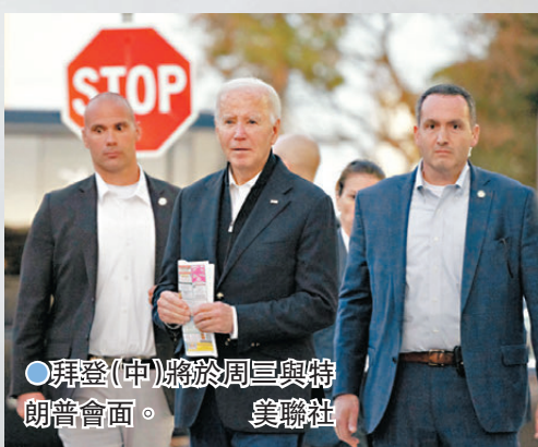
●拜登(中)將於週三與特朗普會面。