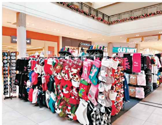
●聖誕購物旺季臨近，港口罷工阻礙零售業補貨。

卑詩省溫哥華港口從11月4日開始關閉，海事僱主協會上週六(11月9日)在網站公布，勞資雙方進行的最新一輪談判沒有任何進展，並未安排下次談判日期。代表蒙特利爾港口約1,200名碼頭工人的工會周日拒絕與僱主協會達成協議，工會指出如果僱主尊重集體談判程序，港口罷工本應可以避免。