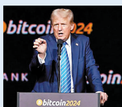
●特朗普一改以往口風，表態支持虛擬貨幣。資料圖片

比特幣今年累計漲幅已達92%，受惠於美國核准現貨比特幣ETF、聯儲局降息等利好消息，市場對比特幣需求強勁。長期看好比特幣的Fundstrat分析師湯姆·李日前預測，比特幣價格今年有望衝破10萬美元(約78萬港元)，認為當局放寬監管有助推動幣價上漲。