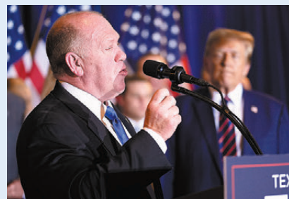
●霍曼移民政策立場激進，支持拆散非法移民家庭。

美國有線新聞網絡(CNN)披露，特朗普將委任共和黨眾議員三號人物、「特粉」斯特凡尼克擔任美國駐聯合國大使。斯特凡尼克披露她已接受提名，對此表示榮幸，希望獲得參議院的支持。