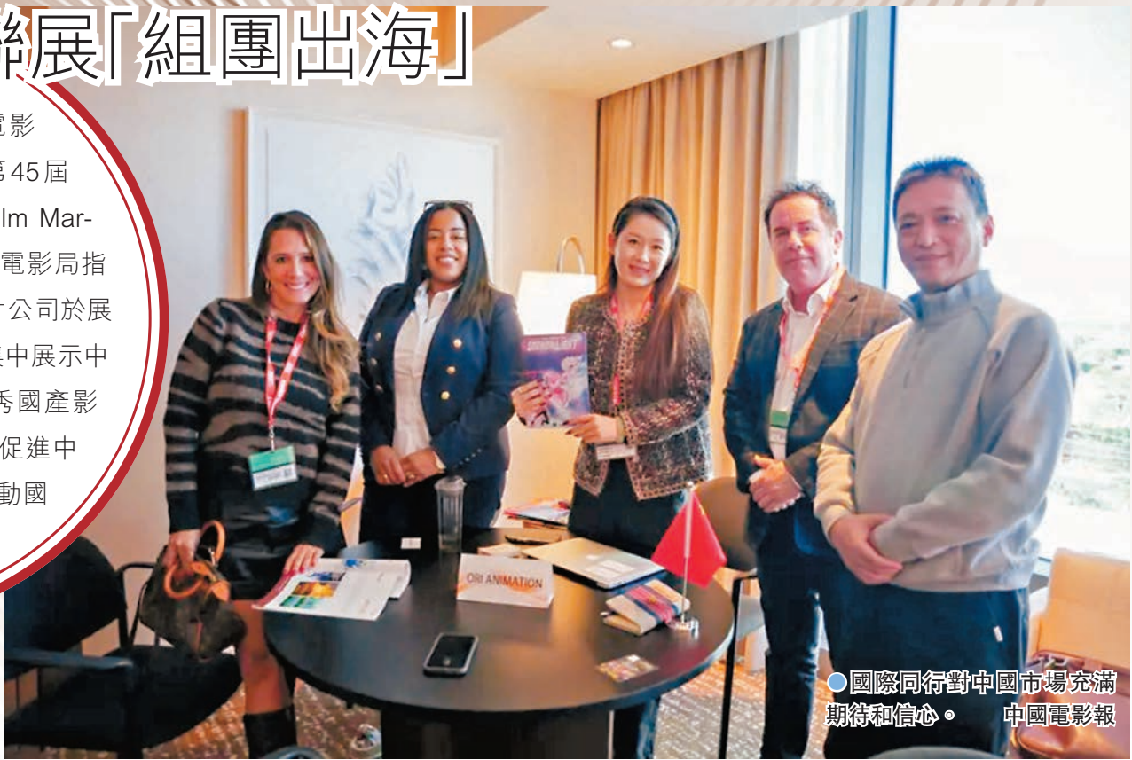
國際同行對中國市場充滿期待和信心。 中國電影報

此次展示推廣，中國影片得到了海外同行的青睞。代表中國參加第97屆奧斯卡獎角逐的《里斯本丸沉