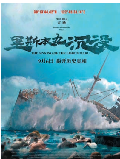
《里斯本丸沉沒》代表中國參加第97屆奧斯卡獎角逐。 資料圖片

沒》走出國門，已在英國多個城市放映，引發全球媒體和觀眾的廣泛關注。今年國慶檔影片《志願軍：存亡之戰》上映首周票房達到1.12億美元，讓海外片商對中國市場的潛力有了新的認識。此外，進口影片《哈利·波特》系列電影在國內重映的出色表現，也進一步增強了國際同行對中國市場的期待和信心。