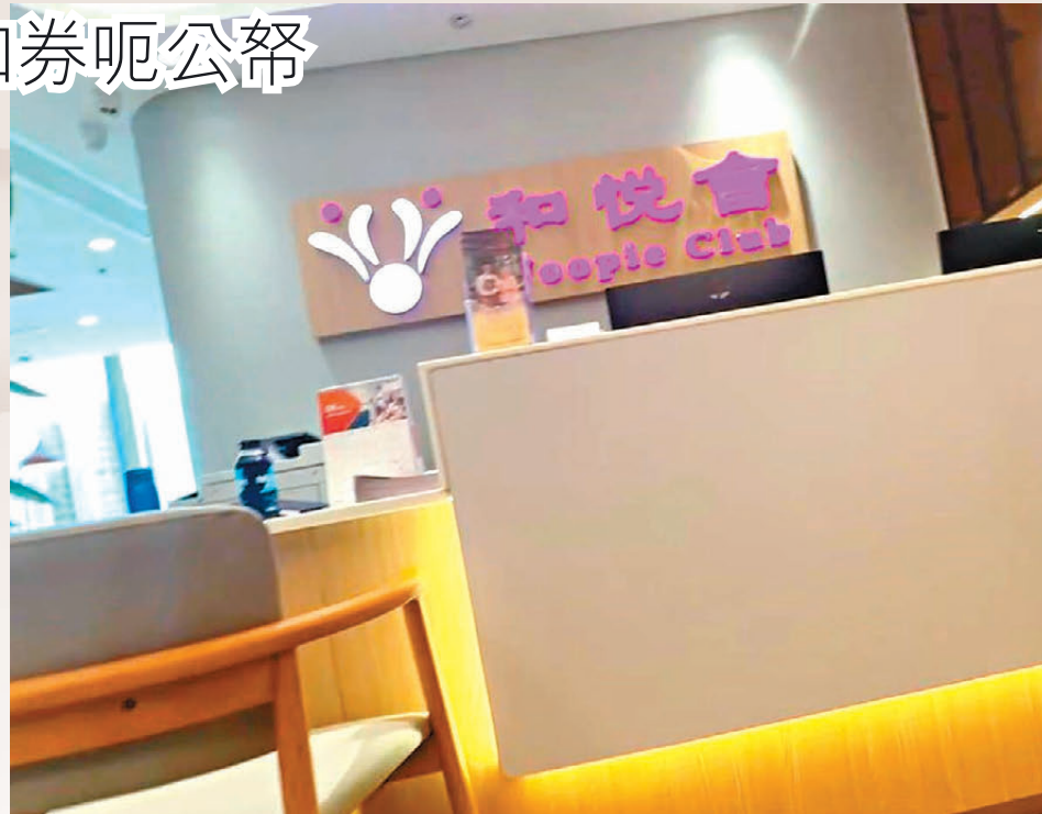
●和悅會其餘12間長者中心都註明社區券認可機構編號，惟獨上水分中心沒有標明編號。

社署發言人昨日接受香港文匯報查詢時承認，上水和悅會社區券認可服務單位的申請仍在審批中。對香港文匯報的發現，署方非常關注，正了解事件及作出跟進，如發現事件涉及任何刑事成分，定會轉交執法部門跟進，同時會審視有關機構在計劃下其他認可服務單位的情況，及採取適當跟進行動。