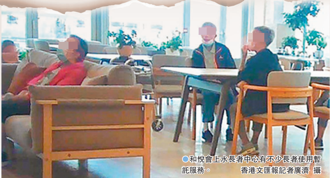
●和悅會上水長者中心有不少長者使用暫託服務。

調查報道 香港人口持續老化，子女往往為搵食疲於奔命而無法親身照顧，社區券就成為合資格長者居家安老的好幫手，讓他們日間得以暫託在認可的私營長者中心，待子女下班接回家享天倫。香港文匯報深入調查發現，這個本年度經常性開支高達9億元的計劃存在監管漏洞：全港擁有13間分店的連鎖長者中心集團和悅會，旗下位於上水的日間長者中心由於不符院舍消防條例，不獲社區券計劃認可，無資格「扣券」，惟和悅會依然安排行動不便的會員長者到該中心使用服務，然後疑借用同集團其他認可長者中心的名義「扣券」，獲取社會福利署每月對每名長者最多9,932元的資助，粗略推算月賺數十萬元。有長者形容自己猶如被賣豬仔，並身陷消防隱患，以及捲入呢公柁風波中。 ●香港文匯報記者 文禮願