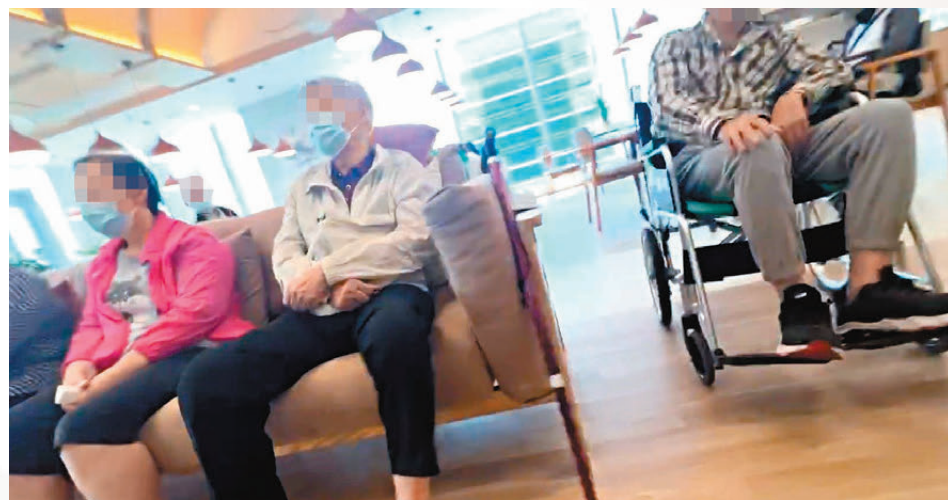
●使用和悅會上水長者中心的會員，不少是行動不便的長者。

就記者所見，一批行動不便的長者置身不符合消防規定的處所內存在風險，但一名黃姓男職員堅稱，中心符合消防要求，又稱中心對出處有條後樓梯可供走火。記者遂質疑該中心的會員多是行動不便或自理能力較遜的老人家，如何能在千鈞一髮間從8樓疏散到地面，黃姓職員只淡定回應說：「走到，無問題。」