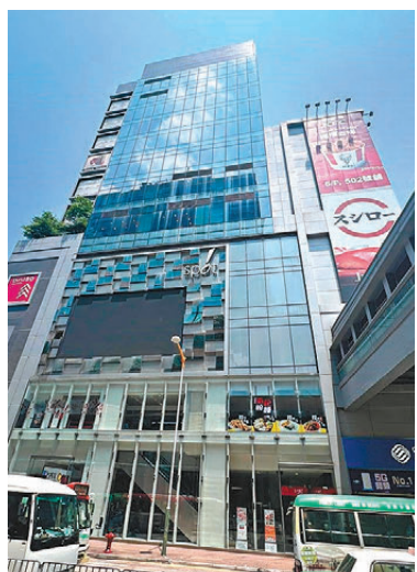
●該中心位於一個商場八樓，樓高超過24米不符院舍消防條例。