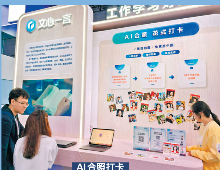
●AI合照打卡 ●AI助力體驗者足不出戶即可在任一個旅遊景點「花式打卡」。