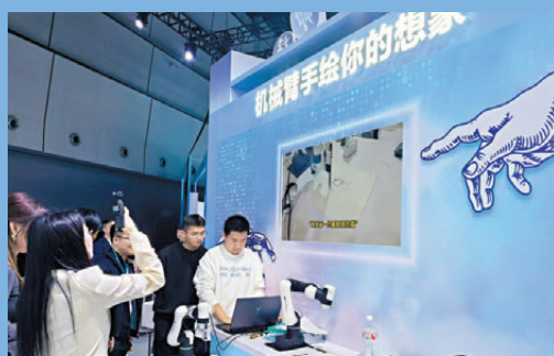
●機械臂借助AI完成素描。