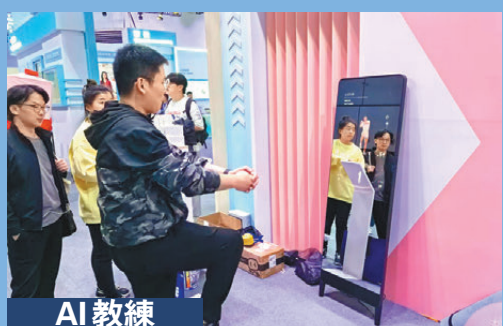
●AI應用小鎮內，體驗者正跟隨AI教練進行鍛煉動作。