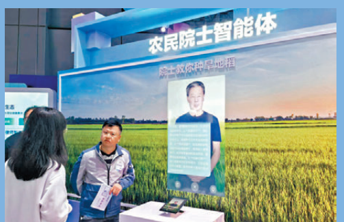
●AI生成「院士」教授種田知識。