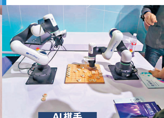
●AI棋手 ●裝載了不同版本大模型的AI棋手正在對弈。