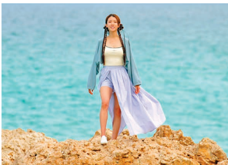
蔡思貝揭秘拍《與天地對話》幕後艱辛。