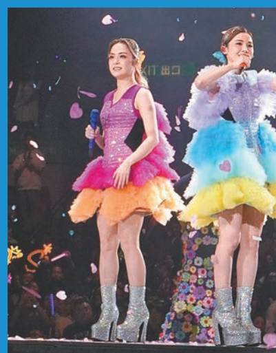
Twins曾在演唱會上為陳慧嫻唱《跳舞街》。