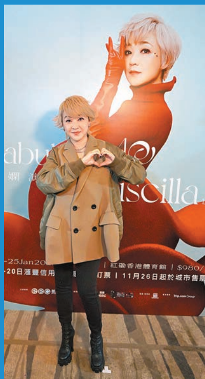
陳慧嫻向粉絲派心。