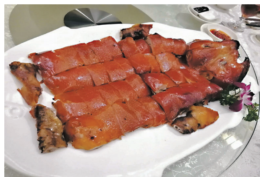
「鴻運乳豬」。資料圖片