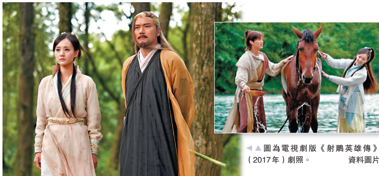
圖為電視劇版《射鵰英雄傳》(2017年)劇照。資料圖片

上聽老頑童周伯通在神志不清時唸過的。這首詞就牽連着瑛姑、周伯通和段皇爺(即一燈大師)三人之間的恩怨情仇。一句「可憐未老頭先白」相當感人，難怪瑛姑也一頭白髮了。