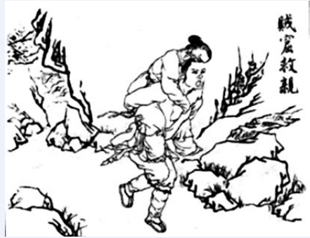
古代二十四孝故事之賊窟救親。

《燕詩》講述燕子長大後背離父母，繼而墮入愛河、築起愛巢、交配產卵、孵卵哺育、雛燕成長，雛燕長大後又離巢而去。一隻燕子十分悲傷，「雌雄空中鳴」，卻無功而還，「聲盡呼不歸」，卻入空巢裏，啾啾終夜悲」。作者於是重提：「燕燕爾勿悲，爾當反自思；思爾為雛日，高飛背母時，當時父母念，今日爾應