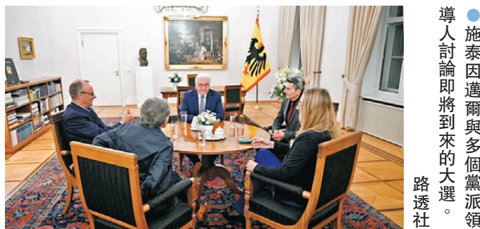
●施泰因邁爾與多個黨派領導人討論即將到來的大選。

法新社報道，握有明確多數席位的政府，將更易於討論德國債務減速機制或為戰略性產業提供資金等議題，但即使大選投票結果明確顯示哪個政黨拿下多數議席，但要組成新的執政聯盟，預料各黨派之間的談判可能持續很長時間才能達成共識，例如朔爾茨當初便花了兩個多月時間，才讓他的政黨和另外兩個聯盟夥伴在2021年達成協議。