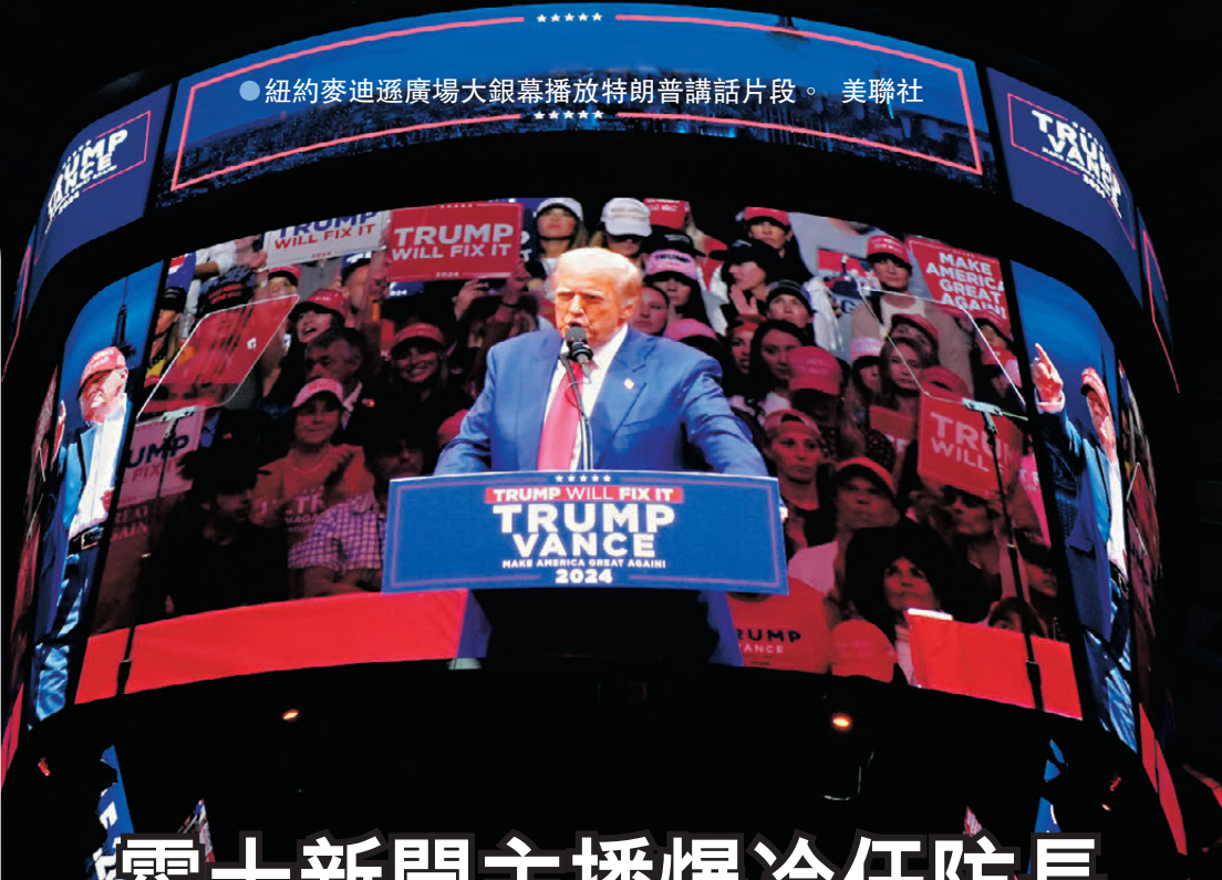
紐約麥迪遜廣場大銀幕播放特朗普講話片段。

香港文匯報訊 美國富豪馬斯克成功協助特朗普入主白宮後，迎來自己的新職務。特朗普周二（11月12日）宣布，任命馬斯克與另一名共和黨籍企業家拉馬斯瓦米合作，共同領導即將成立的「政府效率部」（DOGE）。特朗普宣稱，此舉能為美國節省數萬億美元聯邦開支，尋求「徹底的變革」。多間美媒質疑公告留下許多懸而未決的疑問，新部門如何籌組及營運仍存在不少變數。