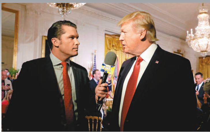
特朗普早前在白宮接受海格塞斯訪問。

香港文匯報訊 特朗普周二（11月12日）宣布，提名霍士新聞主持人海格塞斯擔任國防部長。海格塞斯曾參加過阿富汗和伊拉克戰爭，但沒有更多軍事經驗，即使有文官任職傳統，美國歷任防長仍大多是在軍事領域地位較高的領導人，或軍工企業高層中甄選，海格塞斯被普遍視為「非傳統選項」。