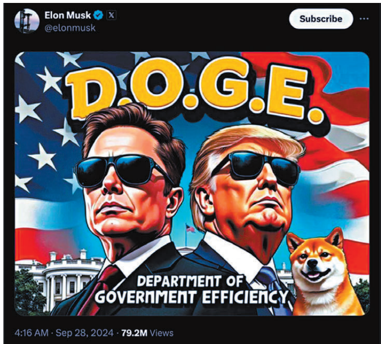
4:16 AM · Sep 28, 2024 · 79.2M Views

特朗普另外宣布，提名得州前眾議員拉特克利夫擔任中央情報局（CIA）局長。59歲的拉特克利夫在特朗普首個任期內出任國家情報總監，他擔任州議員時，還曾致力追查現任總統拜登之子亨特的不法行為。特朗普宣稱拉特克利夫是「為美國人民捍衛真相的戰士」。