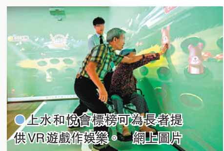
● 上水和悅會標榜可為長者提供VR遊戲作娛樂。

和悅會稱，所有使用和悅會（上水）的長者均屬和悅會（大埔）的會員，集團已主動接觸現正在和悅會（上水）使用服務的和悅會（大埔）會員和家屬解釋事件情況，再次確認家屬及長者均知悉和同意長者接受和悅會（大埔）的護送服務，到和悅會（上水）免費出席活動和享用嶄新樂齡科技、休息睡眠區