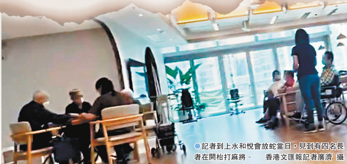
● 記者到上水和悅會放蛇當日，見到有四名長者在開枱打麻將。

特區政府社會福利署於去年底擴展長者暫託服務網絡，加強在社區生活的長者的住宿和日間暫託服務，以紓緩照顧者的壓力，約140間參與改善買位計劃的私營安老院在提供長者住宿暫託服務的同時，亦會在宿位出現空位時，為社區內有需要的長者提供日間暫託服務，使長者日間暫託服務的地點由約50間大幅擴展至約190間。