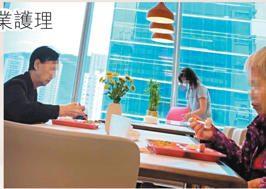
● 長者日間中心提供三餐亦無須食物製造牌照。