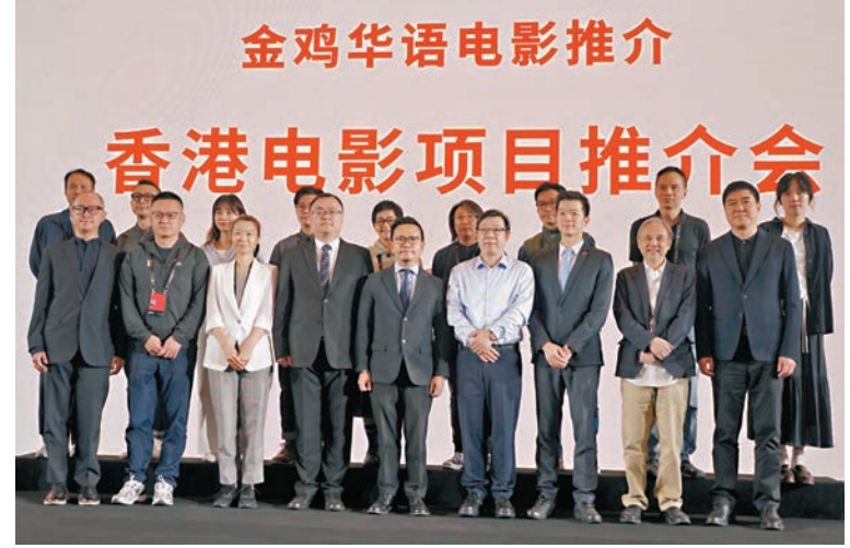
●6個新項目導演團隊與嘉賓等合影留念。

香港電影的復甦得益於國家政策支持，國家政策為香港電影產業提供了廣闊的空間，《粵港澳大灣區發展規劃綱要》及特區政府資金注資助力電影發展；內地與香港文化產業融合帶來更多資源與合作契機；年輕導演勇於創新，結合新時代觀眾需求創作出更具吸引力的作品。6個新項目導演團隊介紹了項目內容和賣點，展現了香港電影的多元性和創新性。香港資深電影導演、編劇、監製陳嘉上，著名監製及製片人、博納影業集團行政總裁蔣德富，著名製片人、彼岸齊觀影文化有限公司總裁姜偉，阿里影業國際內容開發中心總經理林明傑等為項目團隊進行點評。