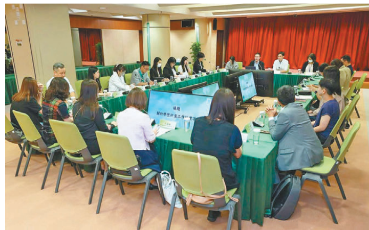
●澳門教育局早前與高校代表舉行學歷核實交流會。

在香港，倘有學生行使假文書並且成功獲錄取，可能被控企圖以欺騙手段取得服務罪。一名24歲內地女子畢業於上海杉達學院，卻向香港大學訛稱畢業於美國康乃爾大學，以假學歷報讀港