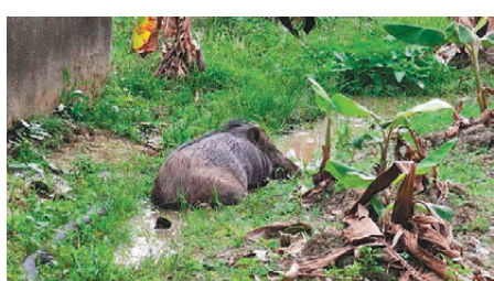
●有野豬在水中享受日光浴，完全不怕人。

香港文匯報訊（記者 蕭景源）打鼓嶺李屋新村前日發生農夫遭野豬襲擊重傷事件，身兼打鼓嶺區鄉事委員會主席的立法會議員陳月明昨日在Facebook專頁發帖及上載影片，顯示野豬在村內四處遊逛休息或闖入耕地吃農作物等，村民生命財產飽受嚴重威脅。陳月明表示，已與環境及生態局跟進事件，政府回應指，會採取相關措施控制野豬危險行為。她會繼續關注事件處理方法，希望同類事件不再發生，保證居民安全。