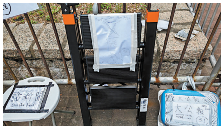
●法院外，包括香港文匯報等多家傳媒機構擺放物品「排隊」。