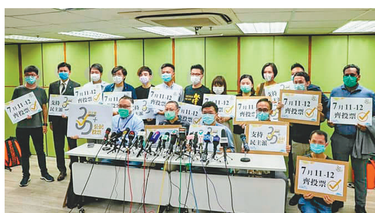
●當日戴耀廷（前排左二）與一眾政棍高調宣布舉行所謂「初選」。

雖然《刑事罪行條例》1996年訂立條文時，香港國安法尚未出現，但立法者當時肯定已預想有類似情況出現，才提到須按罪行的嚴重程度相稱，因此若要與香港國安法第二十二條刑罰相稱，必須採納條文的判刑下限，加上香港國安法清晰的立法意圖，唯一恰當詮釋必然為顛覆罪罰則以及最低刑期仍適用於本案。