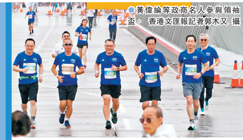
●黃偉倫等政商名人參與領袖盃。