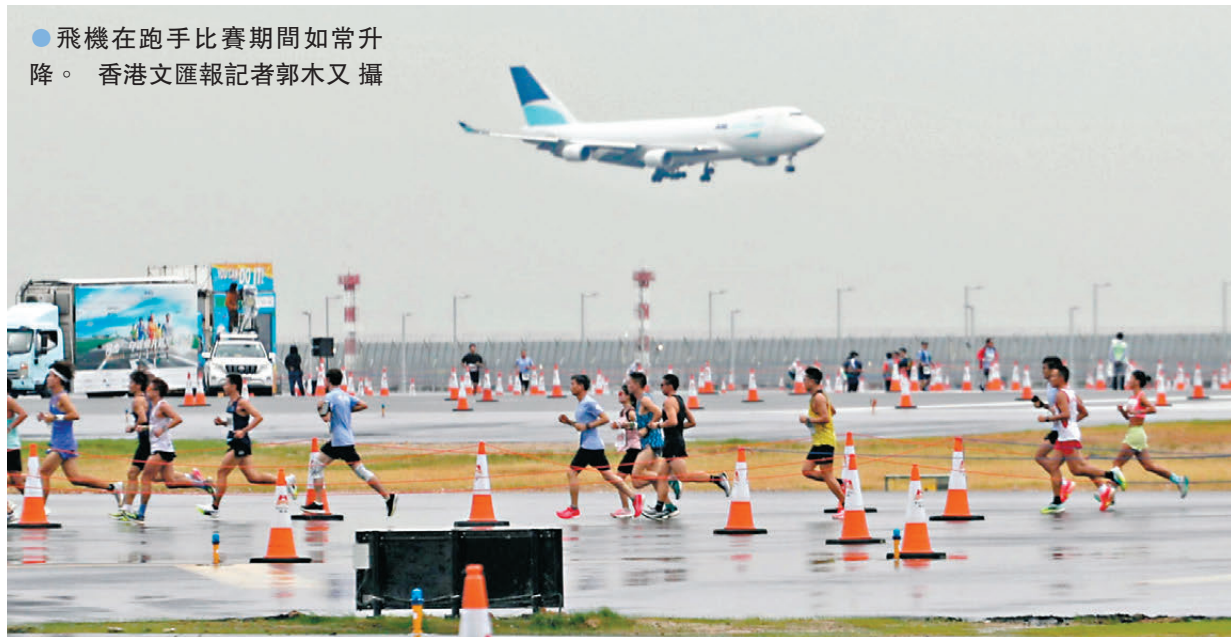
●飛機在跑步比賽期間如常升降。

「三跑道系統十公里國際賽」昨日(17日)早上在赤鱘角機場中跑道微雨中順利進行。這是時隔26年後，再有賽事在機場跑道上舉行，超過1.2萬人參與，雖然由於風雨關係未能締造新的世界紀錄，不過一眾本地跑手均大讚賽事安排及賽道，更以「神奇」來形容今次以飛機升降為背景的難得跑步體驗。