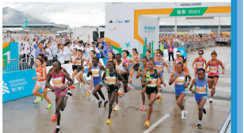
●女子精英組起步一刻。

參賽者盼未來多辦同類型比賽 香港文匯報訊(記者張發兒)香港相隔26年後再度有跑步賽事於機場跑道舉行，吸引不少本地長跑愛好者參賽，參賽者陳先生則認為「三跑」絕對是一項盛事，期望香港會再有這類型的比賽，只要做好宣傳，長遠可形成「長跑經濟」，吸引其他國家的跑手到香港旅遊及比賽，達到刺激旅遊業的效果。 今次「三跑」參賽跑手需於起跑前2小時到達亞洲博覽館，經過安檢後方可乘坐專車前往禁區，參賽者饒小姐認為過程十分順暢：「賽事分了一組、二組起步，今次安檢十分快，基本上不用輪候，15分鐘左右便已經可以上到專車。」 今次「三跑」最特別之處是跑手有機會能夠在跑步的同時看到飛機升降，饒小姐笑言比賽期間亦有觀看周圍的景色：「剛剛都有去留意飛機升降，是一件很興奮的事，不過比賽時有點逆風，自己變速和呼吸方面比平時冬季有所不同，而香港很少有平坦的賽道，最後也能夠跑出自己想要的時間。」 另一參賽者陳先生則認為「三跑」絕對是一項盛事，跑手們都十分享受這個賽事，「做運動精神爽利，最好舉辦多一點類似的賽事。」陳先生期望日後香港會再有這類型的比賽，只要做好宣傳，便能吸引其他國家的跑手到香港旅遊及跑步。他舉例說：「像澳洲的黃金海岸，每年都做得好好，不同地方的遊客都會因此前去旅遊及跑步，始終澳洲天氣不算太差，有利跑手去創最好的時間。」 雖然陳先生對賽事整體安排感到滿意，但他仍認為有可以改善的地方：「起點聚集了不同配速的跑手，速度快啲會左穿右插，慢的會跟回自己速度，導致會有塞車的情況出現，如果可以按跑手的配速在起點分時間區域就會比較理想。」