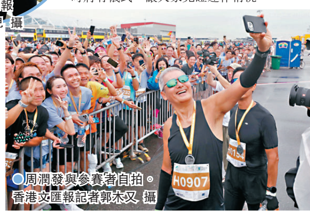
●周潤發與參賽者自拍。

機場管理局主席林天福指，雖然早上落雨但無礙跑手的熱情，有機會在系統啟用前於跑道上視察工程，希望大家享受難得的機會。他透露「三跑」系統在月底全面啟用時將有儀式，讓大家見證運作情況。