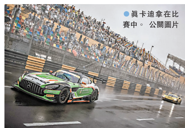
●真卡迪拿在比賽中。公開圖片

由於雨勢很大，比賽先由安全車帶領數圈，直到賽道積水漸退後才正式開始。最終駕駛77號戰車的真卡迪拿成功取得第10位，駕駛99號戰車的古農則成功在賽程被縮短的比賽上超前數個位置，以第19位完成。