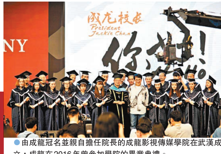
●由成龍冠名並親自擔任院長的成龍影視傳媒學院在武漢成立，成龍在2016年曾參加學院的畢業典禮。

在本屆大賽頒獎典禮舉辦期間，還舉行了第十屆「金飛燕」海峽兩岸微電影微視頻大賽創作分享會。「潮起兩岸 江城映像」兩岸青年武漢文化行活動同步啟動，兩岸青年影視創作人參觀了由國際功夫電影巨星成龍擔任院長的成龍影視傳媒學院以及為大熱遊戲《黑神話·悟空》提供了軟件支持的武