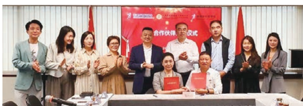
●香港西貢將軍澳工商聯與淄博市兩商會代表在簽署戰

會面期間，代表團受到香港西貢將軍澳工商聯熱烈歡迎。雙方就加強經貿合作協定後合照。