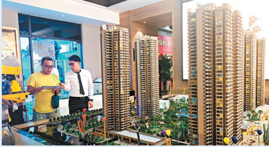
●有分析預料其他內地一線城市也有望跟進取消普宅及非普宅標準，擴大交易稅優惠覆蓋面。圖為廣州一個樓盤售樓處。資料圖片

上海最新政策主要包括三方面內容：一是取消個人出售非普通住宅2%的所得稅，以1%的標準核定徵稅；二是個人出售2年及2年以上住房，免徵增值稅；三是上海個人購房契稅優惠政策與全國統一。結合這幾項減稅政策，房