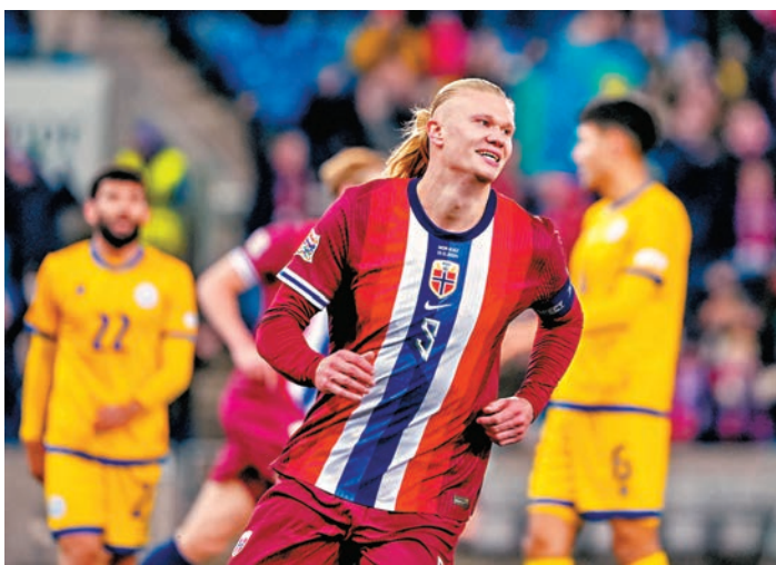
●夏蘭特連中三元領挪威大勝。