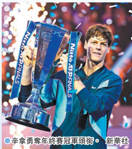
●辛拿勇奪年終賽冠軍頭銜。新華社

香港文匯報訊 據新華社報道,當地時間17日在意大利都靈舉行的男子職業網球選手協會(ATP)年終賽決賽中,世界第一的意大利名將辛拿以6:4、6:4戰勝美國選手費斯,首次奪得該項賽事冠軍。