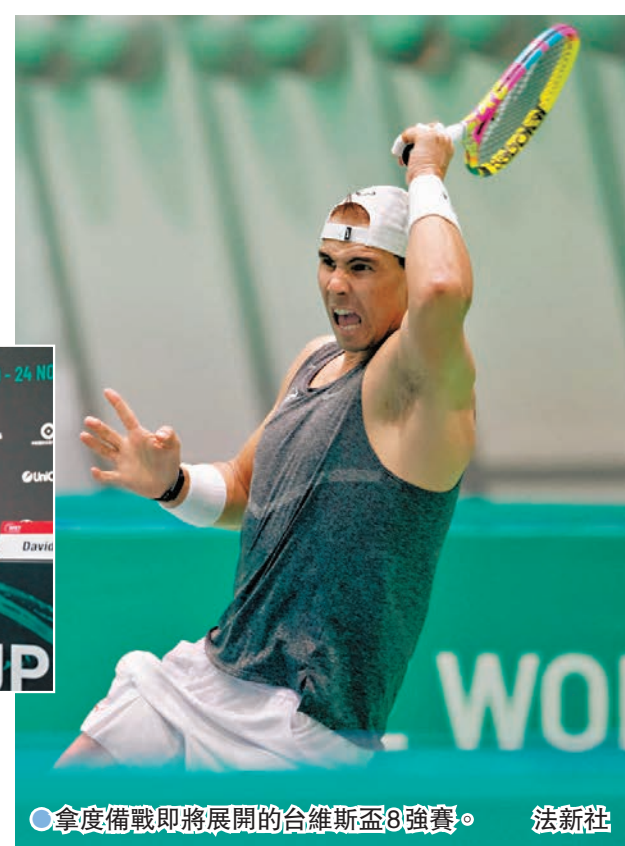
●拿度備戰即將展開的台維斯盃8強賽。