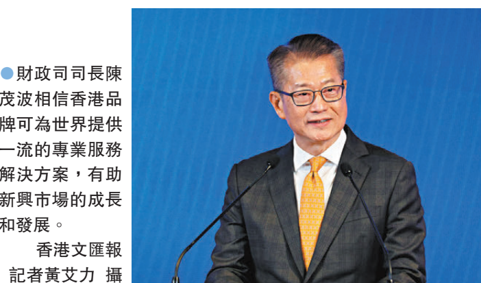
●財政司司長陳茂波相信香港品牌可為世界提供一流的專業服務解決方案，有助新興市場的成長和發展。

香港文匯報訊(記者 蔡競文)對於全球經濟形勢，特區政府財政司司長陳茂波昨日出席「國際金融領袖投資峰會」時表示，香港正面對市場環境變化、地緣政治升溫，也要保持敏銳及創新能力。香港也會繼續接觸歐美等傳統市場，他認為仍有很多領域可找到共同利益並進行合作，包括環境、社會責任及企業管治(ESG)、綠色轉型等範疇。