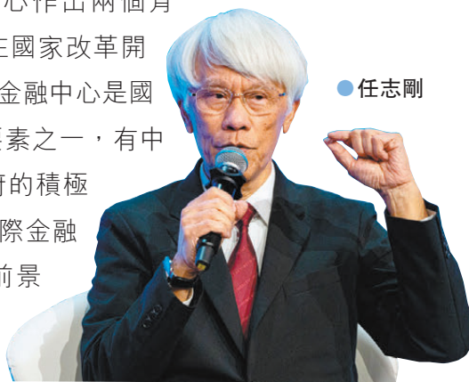
●香港文匯報記者 蔡競文

中共中央政治局委員、國務院副總理何立峰前日在港出席「國際金融領袖投資峰會」主峰會發言時向香港提出三點建議，希望香港緊緊抓住國家改革發展帶來的歷史性機遇。何立峰的講話大大提振了香港工商業界的信心。昨日兩位香港金管局前總裁任志剛及陳德霖，不約而同指出何立峰副總理的三點建議對港意義重大。任志剛表示，何立峰的講話為香港國際金融中心作出兩個肯定：肯定香港國際金融中心在國家改革開放的獨特作用，肯定香港國際金融中心是國家成為金融強國的關鍵核心要素之一，有中央政策的支持，以及特區政府的積極行動，任志剛相信今後香港國際金融中心地位將更加穩固，香港前景將更加秀麗。