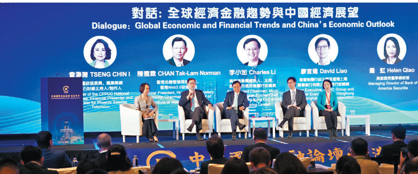
●金管局前總裁、香港 Web3.0 協會會長陳德霖(左二)，滴灌通創始人、港交所前行政總裁李小加(中)及滙豐亞太區聯席行政總裁廖宜建(右二)等在「中國國際金融論壇·香港峰會」上發言。