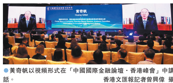
●黃奇帆以視頻形式在「中國國際金融論壇·香港峰會」中講話。

香港文匯報訊(記者 周曉菁)重慶市市長、國家創新與發展戰略研究會學術委員會常務副主席黃奇帆在「中國國際金融論壇·香港峰會」視頻講話中提出，香港在人民幣國際化進程中擔當獨特而關鍵的角色，香港首先要深化人民幣國際化，通過增加人民幣金融產品、發展離岸人民幣結算中心、推動國際貿易中使用人民幣結算等手段，提升人民幣在國際市場上的使用量和影響力。他稱，在人民幣計價的股票、債券、基金等基礎上，未來可以進一步拓展人民幣期貨期權等衍生品市場、推廣人民幣綠色金融產品，滿足全球投資者對人民幣資產的需求。