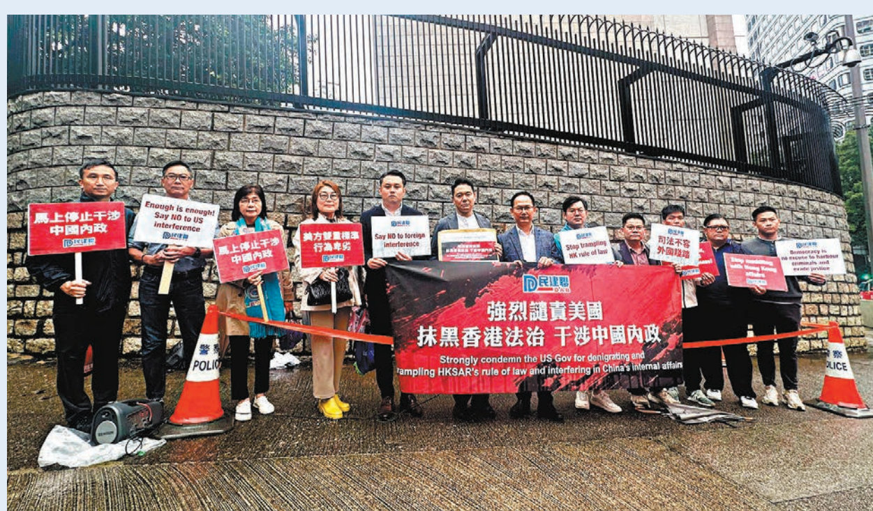
●民建聯昨日到美國駐港總領館抗議。

發言人重申：「根據《聯合國憲章》為基礎的國際法及國際慣例，維護國家安全是所有主權國家的固有權利。很多普通法司法管轄區，包括美國、英國、加拿大等，都制定了多部維護國家安全的法律。美西方國家、反華組織、反華政客、外國媒體等對此視而不見，大放厥詞，是典型的卑劣政治操作和虛偽「雙標」。特區政府強烈要求他們立即停止干涉中國內政和香港事務，以及停止對有關案件的裁決作出任何不實的報道及惡意的抹黑。」