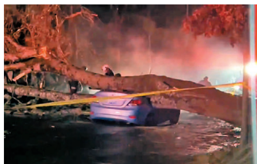
美國強風吹倒樹木壓毀私車。

美國氣象部門則已發布強風預警，覆蓋西雅圖一帶及華盛頓州沿海地區。預計陣風最高達每小時104公里，可能導致樹木倒塌、房屋受損及大面積停電，部分地區的供電可能延遲恢復。卡斯卡德山脈及其山口地區也迎來強降雪，可能出現暴風雪級別的惡劣天氣。運輸部門提醒駕車前往山區的居民需攜帶防滑鏈，並準備禦寒衣物及應急物資，同時建議非必要情況下避免前往。