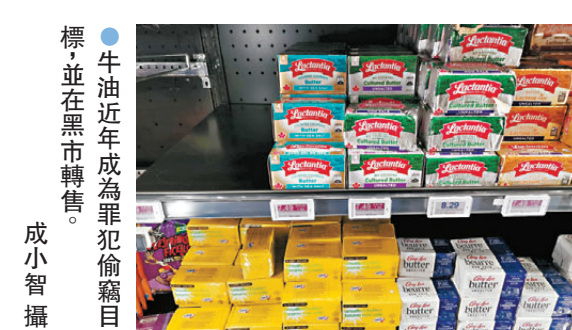
牛油近年成為罪犯偷竊目標，並在黑市轉售。