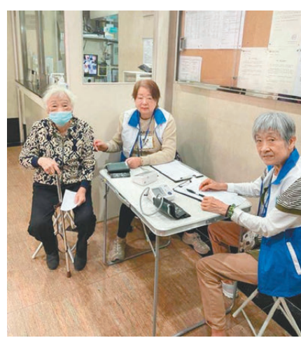
●兆置關愛隊為有需要人士提供量度血壓服務。