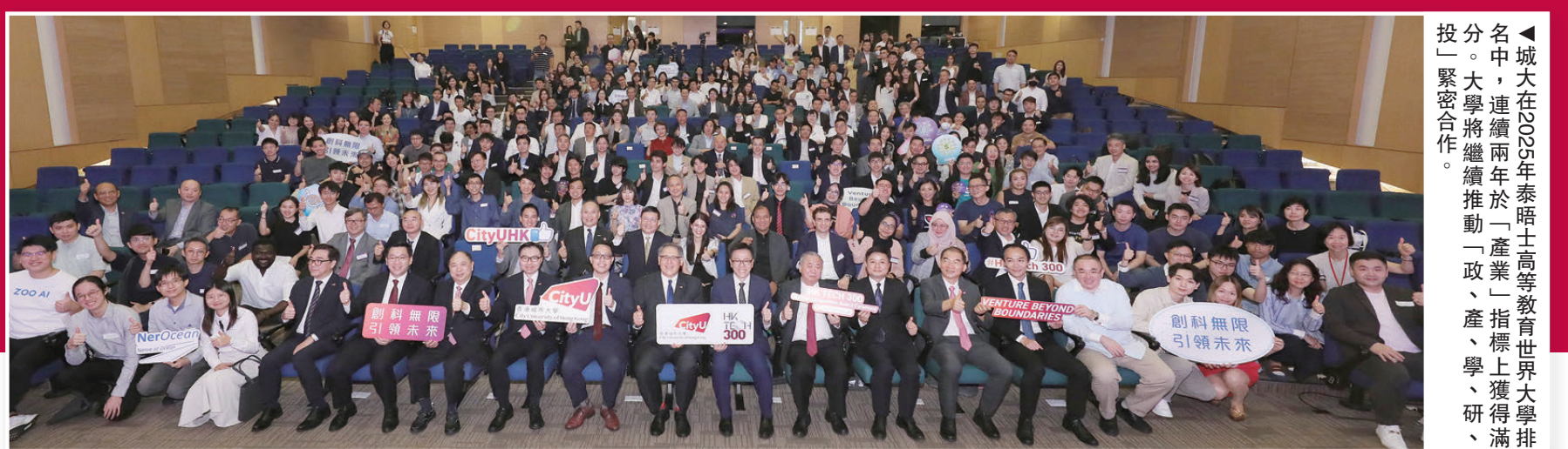
▲城大在2025年泰晤士高等教育世界大學排名中，連續兩年於「產業」指標上獲得滿分。大學將繼續推動「政、產、學、研、投」緊密合作。