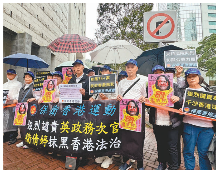
▲日前陸續有香港市民和團體發起抗議行動，譴責美國等少數國家政府及政客抹黑香港法治。

審理只為盡快將騷亂參與者送進監獄，如此兒戲完全罔顧涉案人員正當合法權利。美國等少數國家政府及政客無視自身在維護國家安全方面的嚴刑峻法，在保護自由人權方面的斑斑劣跡，不反躬自省，卻對香港特區依法判決戴耀廷等「串謀顛覆國家政權案」說三道四，橫加干預，其玩弄虛偽「雙標」的嘴臉真是醜陋之極！