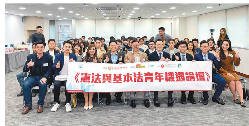
●《憲法與基本法青年機遇論壇》昨日舉行。