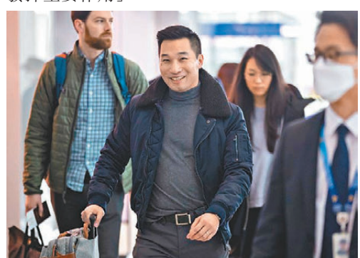
●黃之瀚曾出任朝鮮問題副特別代表。

獲特朗普提名擔任白宮國家安全顧問的沃爾茲表示，黃之瀚在特朗普首個任期內取得成果，宣稱他「將在幫助確保美國安全方面發揮重要作用」。