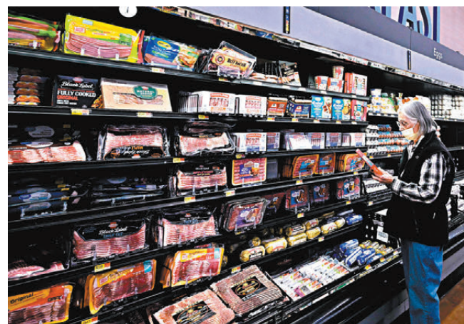
●加徵關稅會將成本轉嫁消費者，刺激通脹攀升、損害經濟增長。資料圖片

特朗普已提名對沖基金經理貝森特擔任財長，早前另一財長熱門人選盧特尼克獲提名商務部長。貝森特和盧特尼克雖支持加徵關稅，但二者都曾表示可以將關稅視作談判工具。分析認為在二者領導下，美國經濟政策可能傾向低稅收勝過高關稅，如果他國作出適當讓步，美國未必會大幅推高關稅。