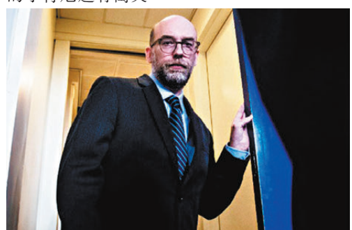
●沃特負責撰寫2025計劃「總統行政辦公室」一章。

54歲的約翰霍普金斯大學外科醫生馬凱利獲提名擔任FDA局長。新冠疫情期間，馬凱利主張民眾佩戴口罩，支持盡快接種新冠疫苗，他的部分醫學觀點，與獲提名衛生部長的小肯尼迪有衝突。