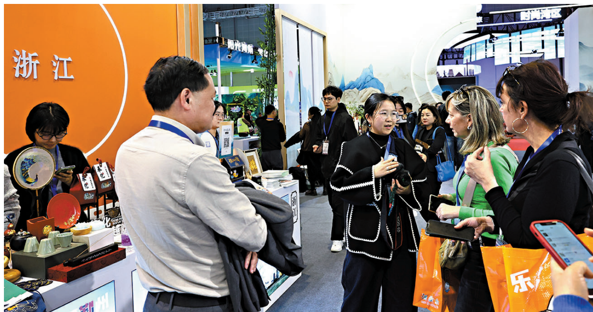
●11月22日,以「你好!中國」為主題的2024中國國際旅遊交易會在國家會展中心(上海)開幕。圖為參觀者在浙江省展台前交流討論。

香港文匯報記者從攜程獲悉,22日相關免簽消息公布半小時後,攜程海外平台歐洲站點、日本站點,中國相關目的地搜索熱度環比分別增長65%、112%。尤其是從日本多地直飛國內目的地的航班熱度大漲。據攜程方面介紹,進入11月以來,日本飛往中國的航班架次比去年已增長超70%,單程含稅均價也下降了約15%。截至此次免簽消息發布前,中日國際航班恢復率大約是2019年同期的75%左右,儘管未完全恢復,但今年以來,日本已經在中國遊客出境遊熱門目的地中排名第一,同時,日本在中國入境遊客源國中排名前三。攜程方面認為,單方面免簽政策的出台,有助於便利在日華人回國探親、旅遊,同時進一步促進中日旅遊交流,促進國內針對日本遊客的旅遊產品開發。