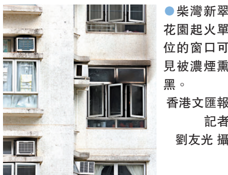
●柴灣新翠花園起火單位的窗口可見被濃煙熏黑。