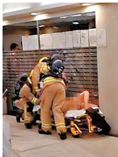
▲男戶主由消防員救出在大堂進行急救。