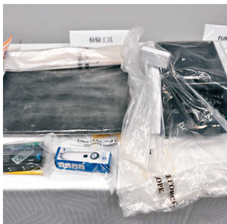
▲警方檢獲涉案的「練功券」。