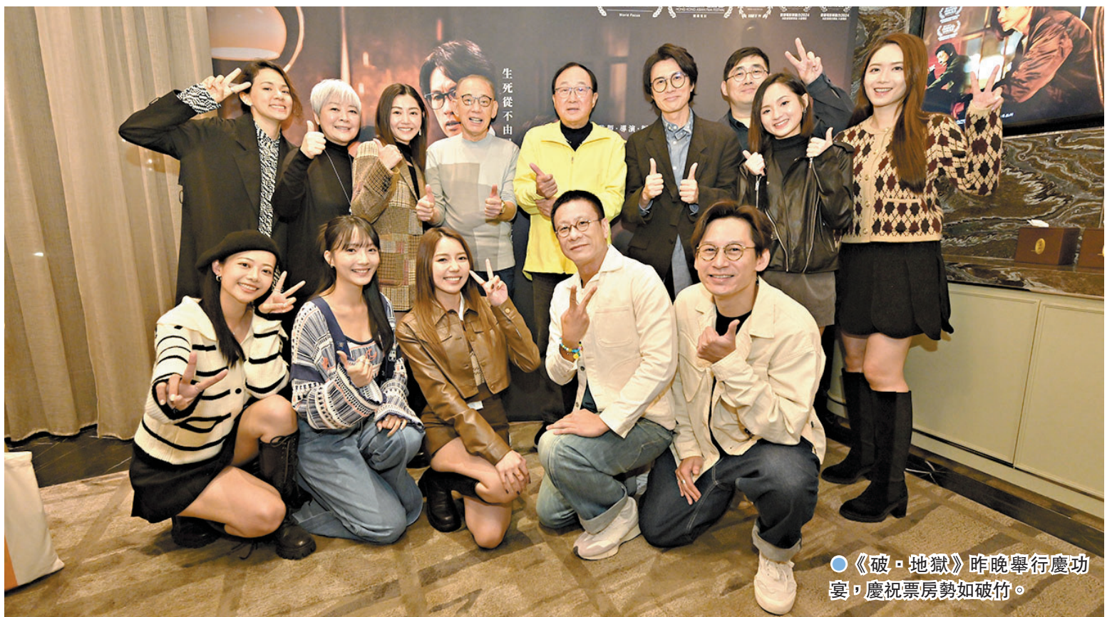
●《破·地獄》昨晚舉行慶功宴，慶祝票房勢如破竹。