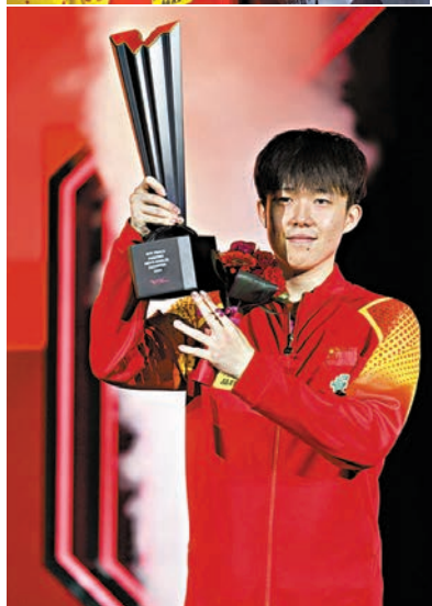
●王楚欽在頒獎儀式上。