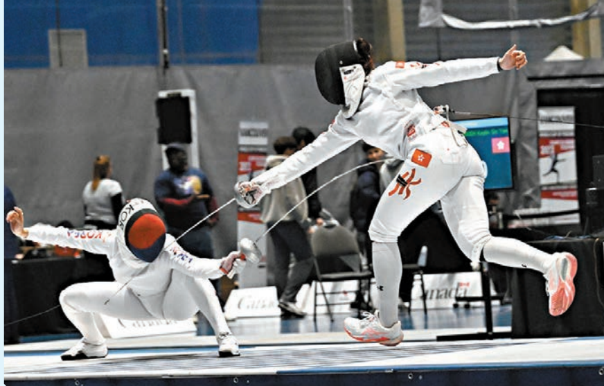
COUPE DU MONDE D'