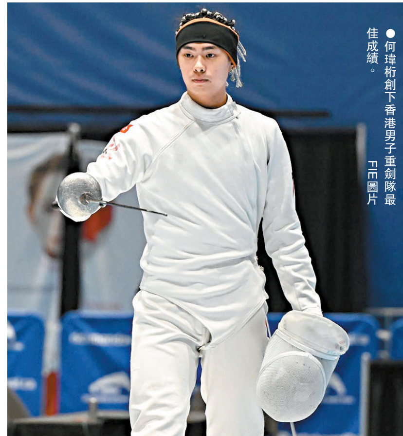
●何瑋桁創下香港男子重劍隊最佳戰績。

新一季劍擊世界盃在月初揭開戰幔，港重劍隊派出7男1女出戰溫哥華站賽事，當中包括應屆亞洲冠軍何瑋桁，以世界排名第18位種子身份直入正賽，而目前在美國就讀聖母大學的余縉妍，則是今站唯一參賽港隊女將。