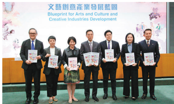
香港《文藝創意產業發展藍圖》昨日公布。