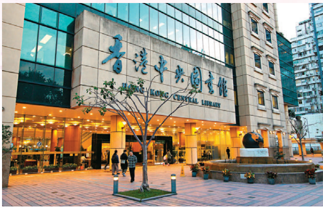
《藍圖》提出檢視香港博物館的整體規劃和公共圖書館及文化設施的功能和設計。

香港特區政府籌備多時的《文藝創意產業發展藍圖》昨日出爐，提出四大發展方向（見表）、71項措施，為香港未來的文化藝術和創意產業發展訂立清晰願景、原則和發展方向，致力弘揚中華傳統優秀文化、發展多元及國際化的文化藝術產業等，將全面提升硬件質素，包括在北部都會區建立一所介紹國家發展和成就的博物館、在九龍公園設立中華文化體驗館，研究放寬不同場地的限制，例如容許工廈改建為小型劇場；又建議檢討現行「人才清單」完善文庫人才庫的生態鏈，以及檢視藝團資助制度等。香港特區政府表示，會提速提效開展工作，並適時優化《藍圖》的措施，期望於2034年文化藝術和創意產業的增加價值達至2,000億元，就業人數增至26.4萬人，為拉動經濟發展提供源源不絕的動力。（相關新聞刊A2）