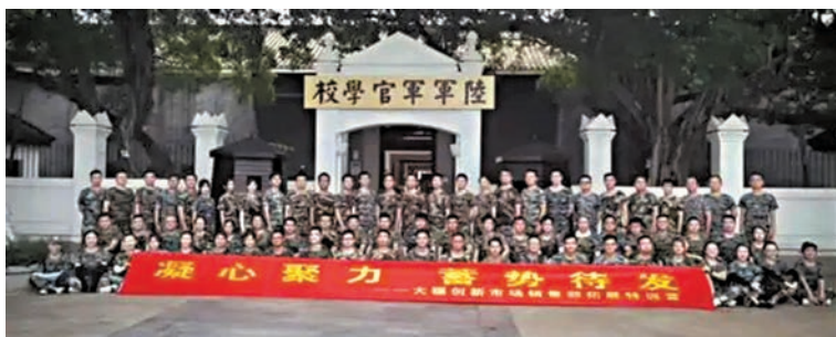
●2020年9月，大疆公司員工在黃埔軍校戶外拓展訓練合影。