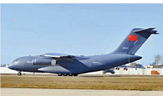
●運-20赴韓接運第十一批在韓志願軍烈士遺骸回國。網上圖片

據了解，11月28日志願軍烈士遺骸回國時，將由2架運-20在中國領空為執行接運任務的運-20伴飛護航，以「雙20」列陣長空告慰革命先烈，表達崇高敬意。