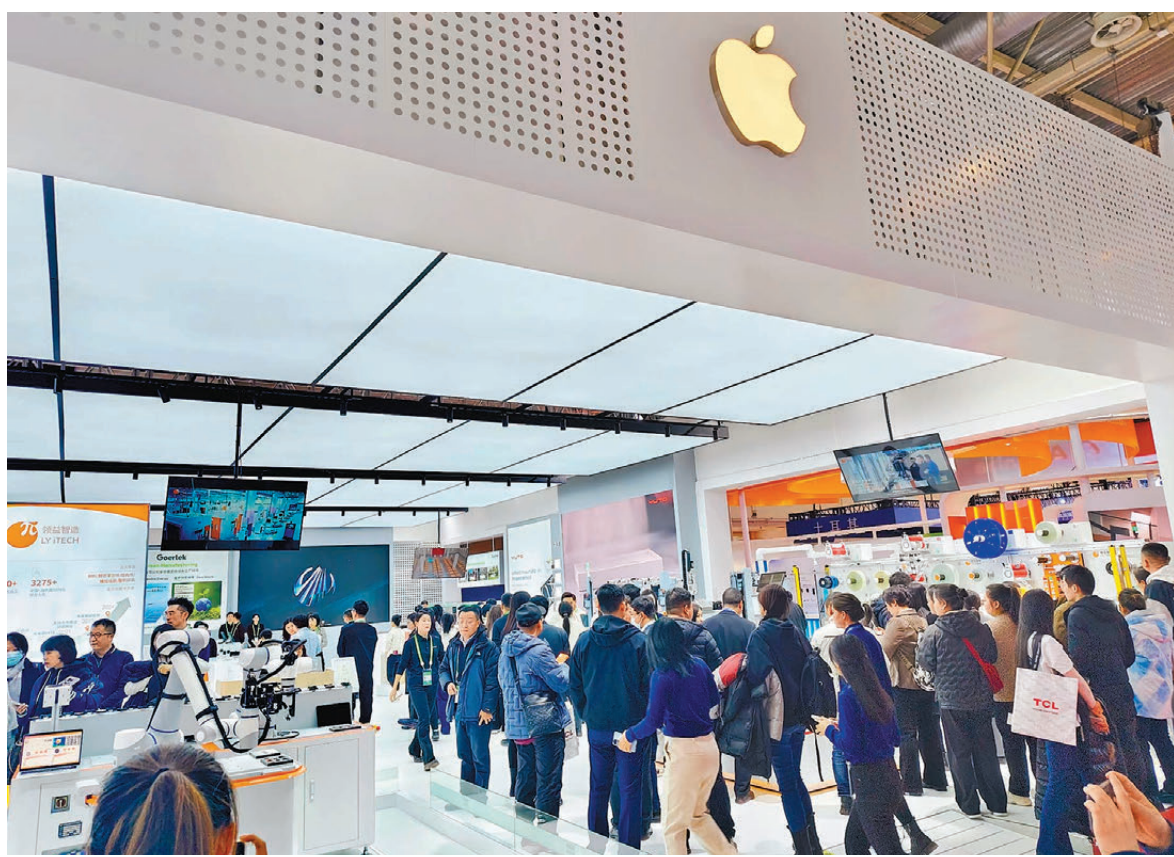
● 第二屆中國國際供應鏈促進博覽會11月26日在北京開幕。圖為蘋果展台前人頭攢動。