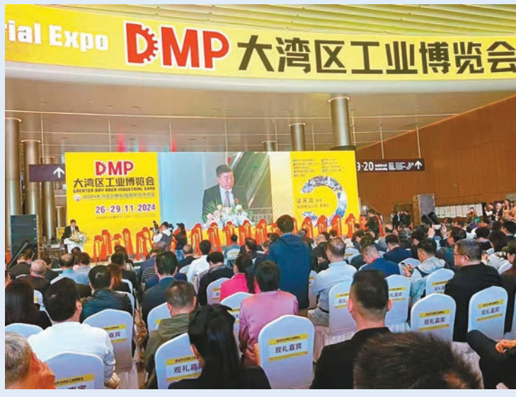
▲大灣區工博會開幕，吸引逾百家港企參展。