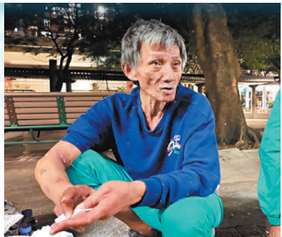
●阿強因不堪板間房木虱困擾而選擇露宿。