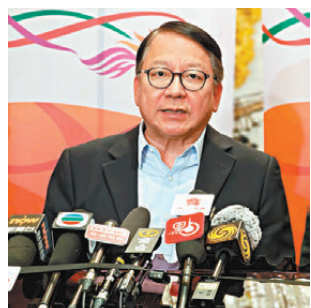
●香港特區政府政務司司長陳國基在行程最後一站深圳介紹訪粵成果。