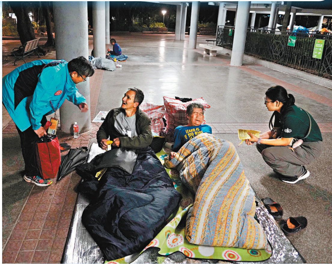
●社協在大角咀送暖，不但向露宿者嘘寒問暖，還派發香蕉、飲品及外套等物資。