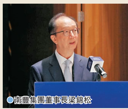
●南豐集團董事長梁錦松。