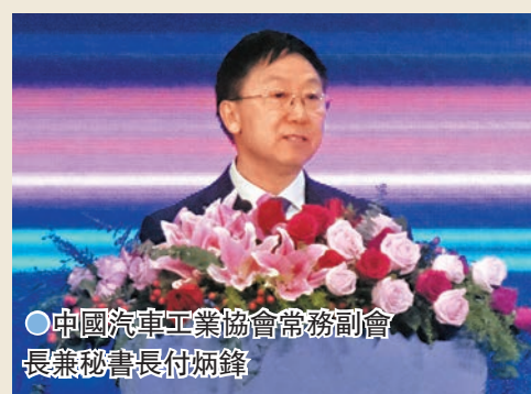
●中國汽車工業協會常務副會長兼秘書長付炳鋒。