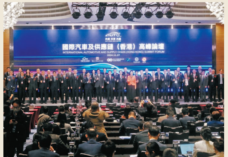
●國際汽車及供應鏈（香港）高峰論壇昨在港舉行，內地汽車企業、汽車供應鏈企業、香港金融機構齊聚，共同研討新能源汽車及供應鏈的發展與未來。