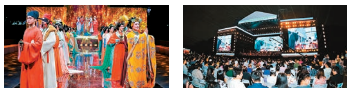
●節日大道唐代服飾大秀。 ●深圳福田蓮花山音樂節。

「深圳旅遊經濟發展處於全國領先地位，其中一個重要原因就是抓住了香港居民來深圳消費的機遇。」戴斌認為，香港蘭桂坊的包容、開放，讓遊客能真切體驗到鬆弛感，這是內地需要學習的，「這並非簡單照抄照搬，而是要多一點耐心與智慧，以當地人民的美好生活來吸引遊客。另一方面，像深圳經常上演的無人機表演，給城市賦予了科技與時尚兼具的未來感，或許也可以推廣到香港去。」