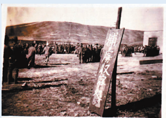
●侵華日軍在南京東郊仙鶴門設立的「俘虜收容所」，在這裏臨時關押的大量中國軍民被分批屠殺。

據侵華日軍南京大屠殺遇難同胞紀念館文物部主任艾德林介紹，其中一張照片是日軍蘇州東吳旅社慰安所的照片，照片中的建築上有「東吳旅社」字樣，該照片拍攝時間為蘇州淪陷後。據有關資料記載，日軍佔領蘇州期間將東吳旅社改造為慰安所。