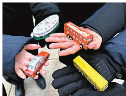
●培僑中學師生為志願軍烈士帶去「香港心意」——多件香港標誌性的交通工具模型。