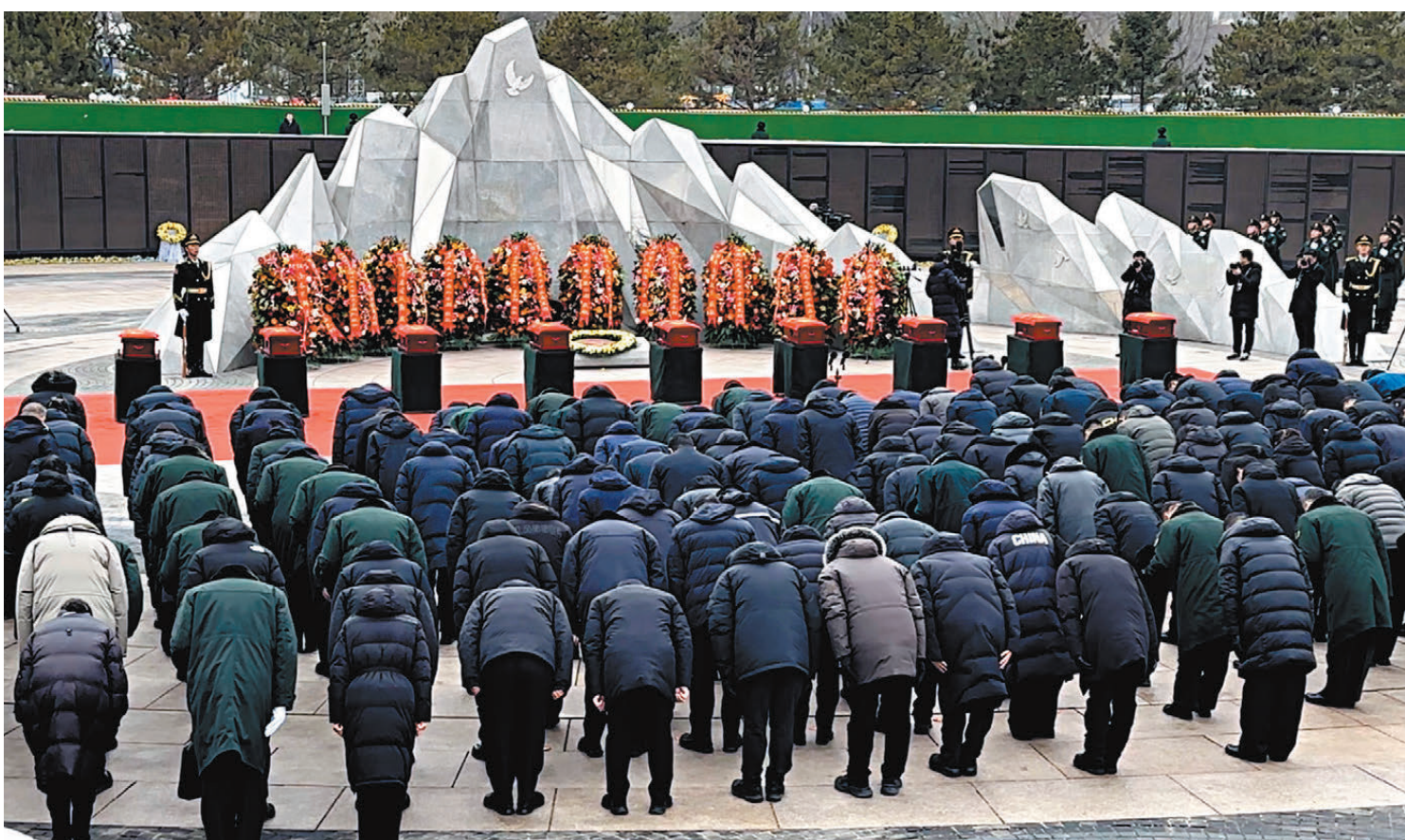
●社會各界人士代表共300餘人在安葬儀式現場向烈士遺骸三鞠躬。