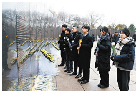
●香港培僑中學師生在瀋陽抗美援朝烈士陵園內的英名牆前祭奠憑弔，並獻上鮮花。