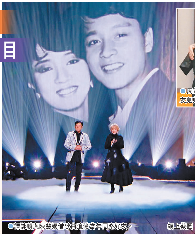
●譚詠麟與陳慧嫻借歌曲追憶當年同路好友。

眾星雲湧的上世紀九十年代，香港成功輸送了以「四大天王」為主打標籤的香港流行音樂文化。這個十年，節目舞台從周慧敏《自作多情》驚喜開麥，引發了一眾觀眾對她「白月光」的青春愛慕；對於離開樂壇有一段日子的薛凱琪，如今登上為港樂而歌的舞台，