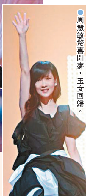
●周慧敏驚喜開麥，玉女回歸。