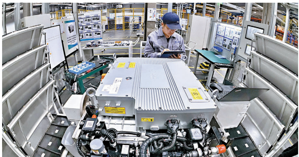
報告指中國本輪宏觀政策調整有力扭轉了短期經濟下行趨勢。圖為北京大興一家生產氫能燃料電池發動機企業。

「競爭與合作並存」，有序競爭、積極合作尋找和維護兩國共同利益；加強各個層級的溝通與對話，包括元首外交、部長會晤、經濟領域對話、民間交流；有效管控分歧，共同承擔大國責任。