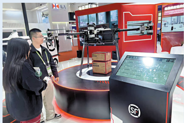
順豐在深圳建成快遞無人機運管基地7個，每日飛行次數超一千架次。

「這裏展示的是香港超高层混凝土模块住宅體系，它是粵港澳大灣區首個混凝土MIC超高层私人住宅項目，較傳統建造模式工期節省30%以上。」在「先進製造鏈」展區，廣州建築集團展台負責人向香港文匯報記者介紹MIC模块化建築。