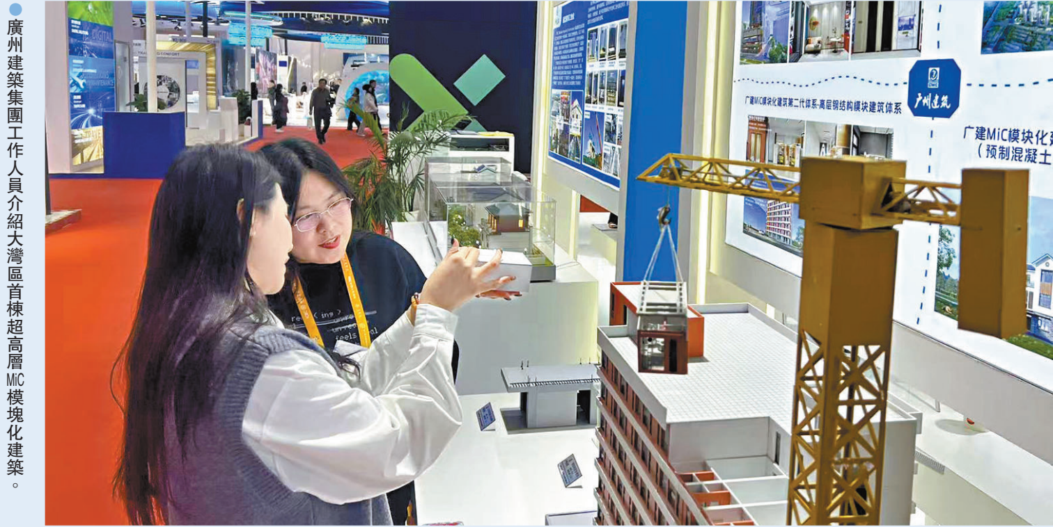
廣州建築集團工作人員介紹大灣區首棟超高层MIC模块化建築。

第二屆中國國際供應鏈促進博覽會（簡稱「鏈博會」）11月30日落下帷幕。參展商中，廣州建築、TCL、中興通訊、順豐速運等覆蓋各鏈條的53家大灣區龍頭企業，集中展示在國際產業鏈供應鏈中處於核心關鍵環節的技術、產品和服務，全面展現以產品技術的率先突破，引領帶動產業鏈向上提升的行業領軍形象。與會香港嘉賓對香港文匯報記者表示，本次鏈博會展出眾多前沿科技和創新產品，令人大開眼界，更向世界證明了數字化、綠色化是產業鏈供應鏈升級的大方向，香港應把握這一趨勢，推動相關產業發展。