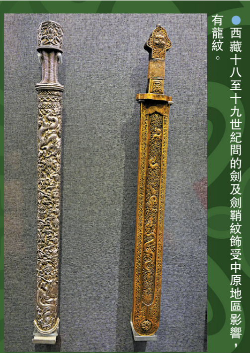
●西藏十八至十九世紀間的劍及劍鞘紋飾受中原地區影響，有龍紋。