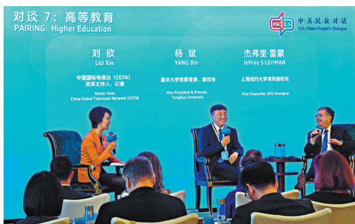
●中美藝術家在高等教育議題對談環節。