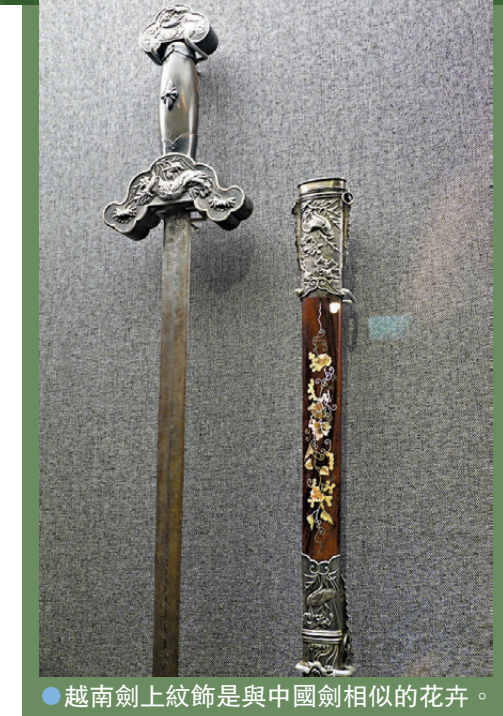
●越南劍上紋飾是與中國劍相似的花卉。