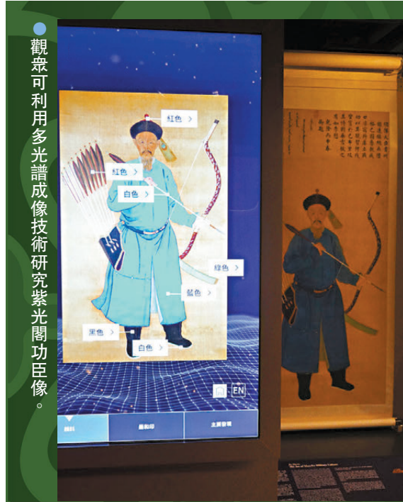
●觀眾可利用多光譜成像技術研究紫光閣功臣像。