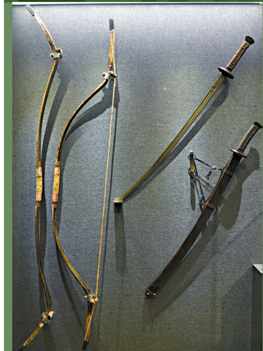
●紫光閣功臣像中對應的弓箭、劍等亦有展出。