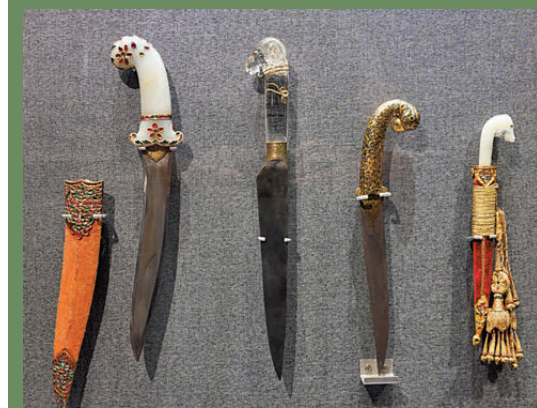
●印度皇室以動物形象為柄製作的匕首。