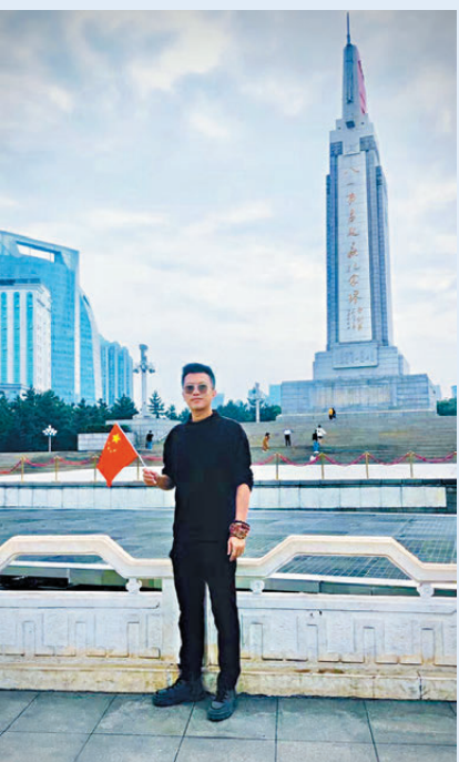
●作者在八一南昌起義紀念塔前拍照。

這周我路過南昌市，特意到地標建築「八一南昌起義紀念塔」拍照打卡，致敬先輩。塔的正北面是「八一南昌起義紀念塔」九個銅胎鑲金大字，另外三面分別是「宣布起義」「攻打敵營」「歡呼勝利」三幅大型