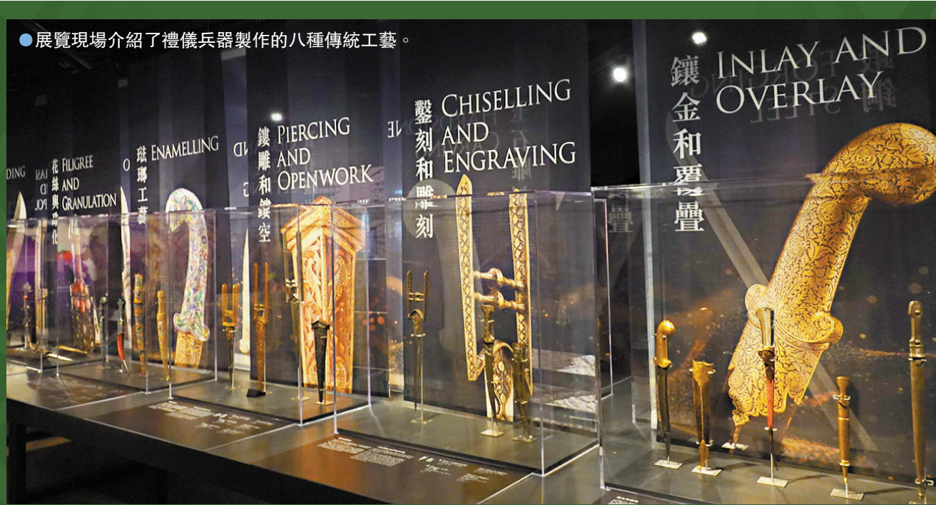
●展覽現場介紹了禮儀兵器製作的八種傳統工藝。