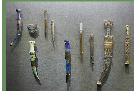
●土耳其鄂圖曼時期的禮儀兵器。