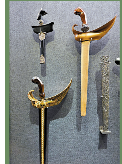
●印尼的格里斯劍（Kris）彎曲的劍柄常飾以船形。

「威武奢華：跨文化禮儀兵器藝術展」 展期：即日起至2025年2月23日。 地址：香港城市大學（城大）般哥展覽館