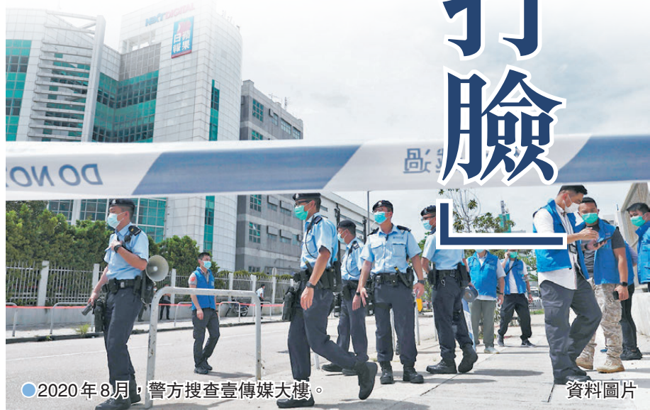
●2020年8月，警方搜查壹傳媒大樓。

法官李運騰其後指出，其中一個帖文註明了羅傑斯(Benedict Rogers)是 IPAC 的顧問，而黎與 Benedict Rogers 非常相熟，問黎 Benedict Rogers 曾否向他提及 IPAC。黎稱沒有，又稱即使其 Twitter 帖文為 IPAC 宣傳，但自己不認識 IPAC，與 IPAC 創辦人裴倫德(Luke de Pulford)不熟悉，也未聽過《香港安全港法案》。