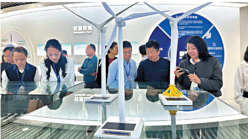
●考察團在陽江(陽東區)綠能示範產業園了解陽江發展綠能得天獨厚的一些優勢。

香港文匯報訊(記者 敖敏輝、胡若璋 陽江報道) 11月30日至12月2日,「活力灣區·澎湃動力」——香港工商界陽江交流考察團深入陽江多地探訪、考察。在全球綠色低碳發展的大浪潮中,陽江正在打造具有國際影響力的「綠能之都」,風電產業正是其核心布局。1日到2日,考察團先後來到位於陽江的國家海上風電裝備質量監督檢驗中心、廣東明陽新能源科技有限公司、廣東陽江(陽東區)綠能示範產業園,了解國際先進的風電裝備檢測平台運作情況和全國最大規模風電葉片和整機生產基地。記者了解到,目前,陽江正加強與香港在風電領域的合作,除了為香港提供風電設備檢測服務,還與香港理工大學開展海上風電聯合研究。