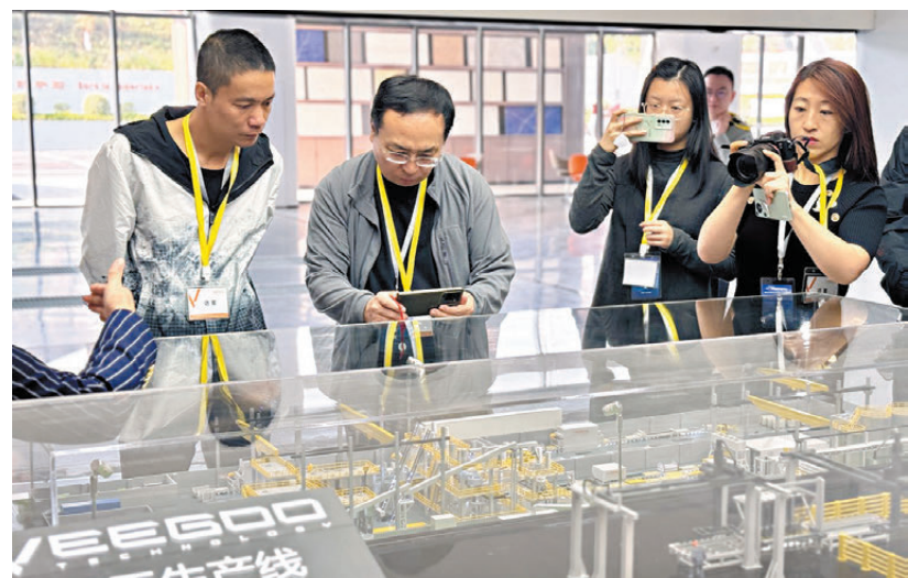
●海外華媒采風團走訪獅山鎮的智能製造和高新技術企業。

香港文匯報訊(記者 李紫妍、田欣妍 佛山報道) 全球市場份額第一的石材智能製造企業、照明產品遠銷歐洲的高新技術企業……2日,海外華文傳媒合作組織2024廣東高質量發展采風活動收官站走進位於粵港澳大灣區核心區域的「超級小鎮」——佛山獅山鎮,察看粵港澳大灣區發展的鎮域縮影。「小鎮」其實不小,其不可小覷的隱藏實力更是讓海外華文媒體代表們感到驚訝:300多平方公里的面積上,百萬級的人口,1,800多家規模以上企業在這裏發展壯大,鎮支柱產業涉及有色金屬、鋁材、生物醫藥、新材料、汽車、燈具等多個領域,連續四年位列「2024中國鎮域高質量發展500強」首位。當天,海外華媒代表們走訪了當地兩家高科技企業,感慨粵港澳大灣區連村鎮都「藏」着許多極有實力的企業,紛紛表示接下來將進一步牽線搭橋,助力當地中小企業抱團出海。