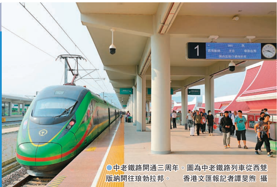
●中老鐵路開通三周年。圖為中老鐵路列車從西雙版納開往琅勃拉邦。