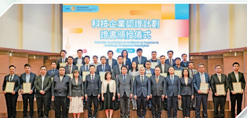
●《科技企業認證計劃》證書頒授儀式。