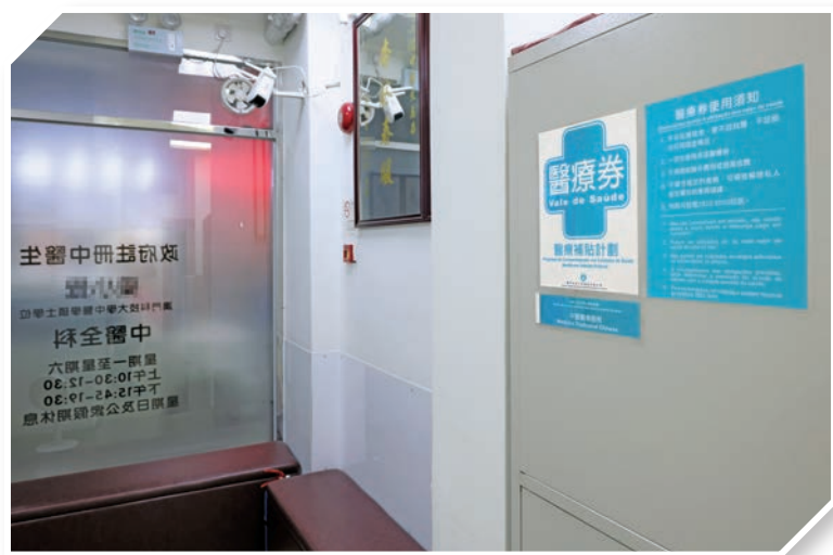
●澳門特區政府持續發放醫療券。