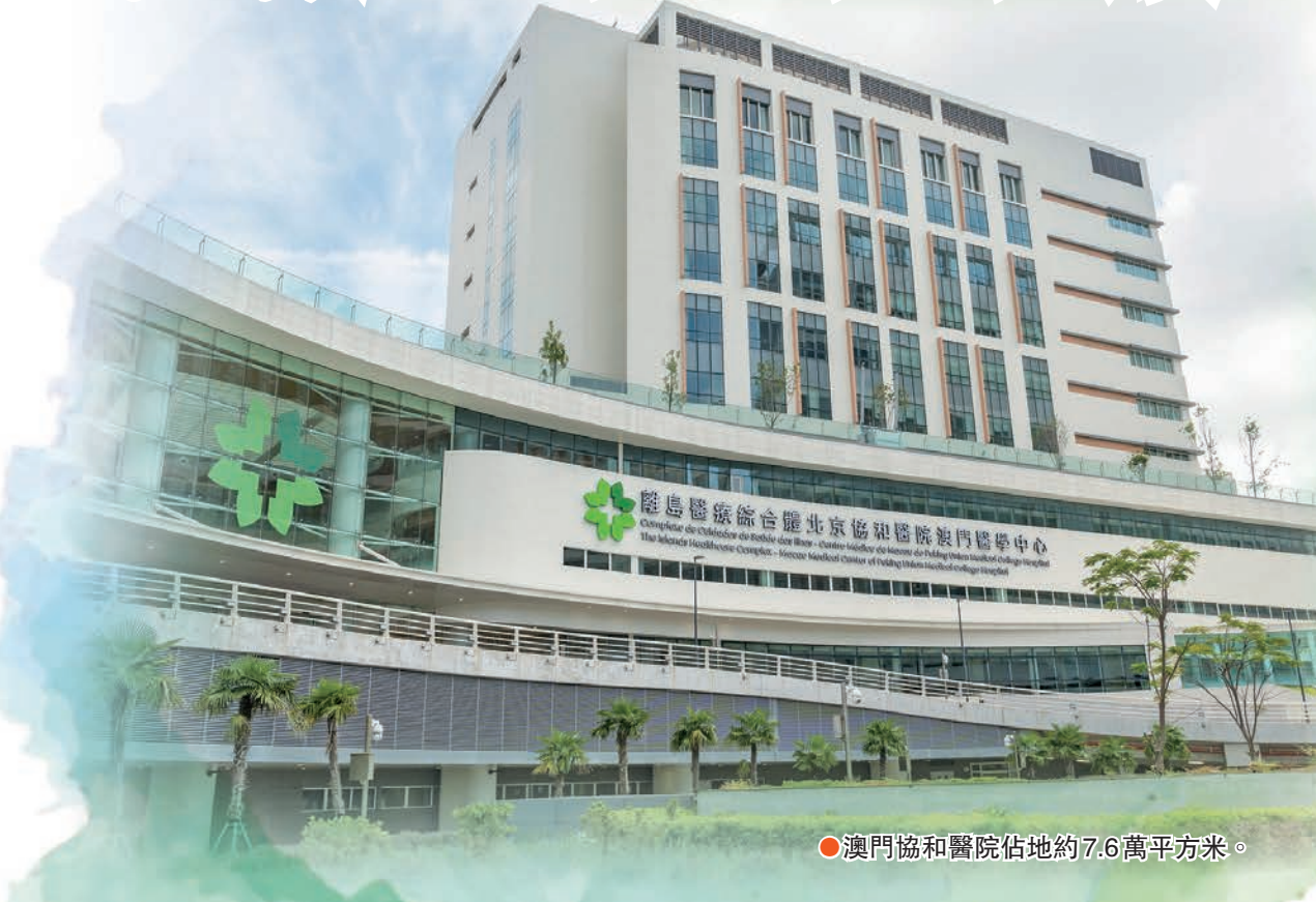
●澳門協和醫院佔地約7.6萬平方米。

施和醫療服務的不斷優化，澳門正朝成為國際知名醫療旅遊目的地的目標穩步邁進。與此同時，澳門正積極制定《私營醫療機構業務法律制度》，增設日間醫院類別准照。