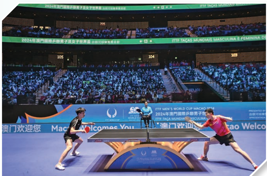
●澳門國際乒聯男子及女子世界盃。

近年來，澳門成功舉辦了一系列具有吸引力和精彩多元的體育品牌盛事。從大賽車的轟鳴聲中，到澳門國際乒聯男子及女子世界盃的激烈對決，這些賽事不僅展現了澳門在體育領域的雄厚實力，更吸引了大量國內外遊客前來觀賽旅遊。在賽事期間，酒店入住率屢創新高，旅遊、餐