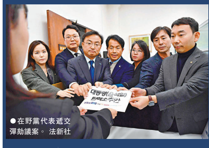
在野黨代表遞交彈劾議案。

戒嚴風暴 香港文匯報訊 韓國總統尹錫悅周二(12月3日)晚間發起的「短命戒嚴」，僅維持6小時便告結束，尹錫悅的從政生涯也因此「政治自殺」步入倒計時。韓國6個主要在野黨在最大在野共同民主黨領導下，周三正式宣布提交彈劾尹錫悅議案，預計最快周五即可在國會投票。韓內閣成員周三集體遞交辭呈。被指推動戒嚴令的國防部長金龍顯同遭在野黨彈劾，他證實已經請辭，並向全民致歉。尹錫悅周四發表講話，將就戒嚴令道歉但拒辭職。