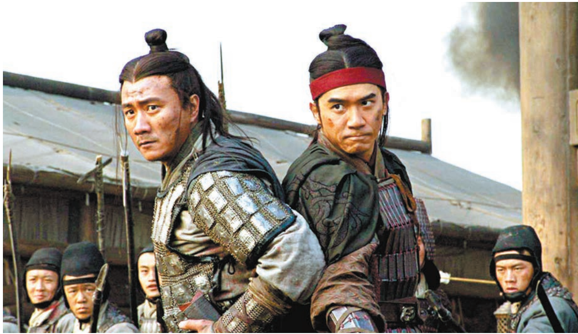
●圖為電影中的周瑜(右)與趙雲(左)形象。

至於第「二氣」，正如《三國演義》所說，周瑜之計謀施行而被諸葛亮識破，留下「賠了夫人又折兵」的笑柄。試想那時劉備羽翼未豐，若周瑜之計謀真的被孫權所採納，恐怕歷史都要改寫。在《資治通鑑》記述，後來劉備知道周瑜上疏的內容，嘆曰：「天下智謀之士，所見略同」，因孔明「諫孤莫行，其意亦慮此也。孤方危急，不待不往，此誠險塗，殆不免周瑜之手！」可見劉備他早已認清形勢，又怎可說有人上當？孫權將妹嫁給劉備，這