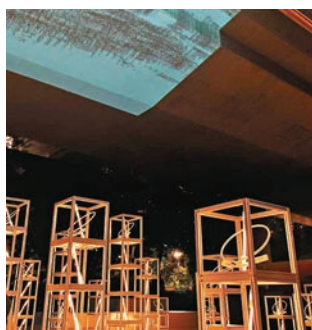
● 展覽利用天橋底作為投影屏幕。