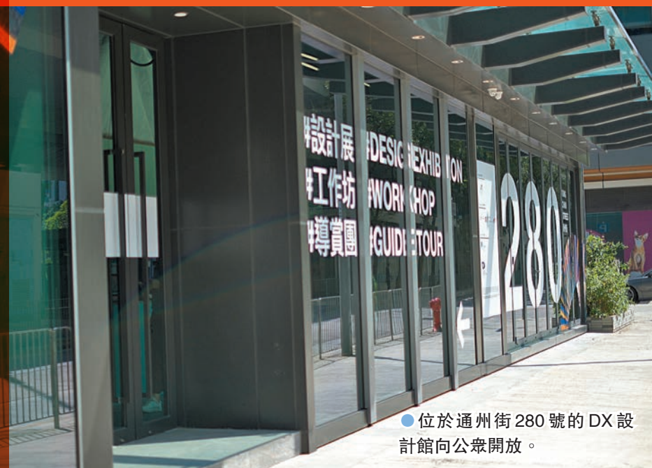
● 位於通州街280號的DX設計館向公眾開放。