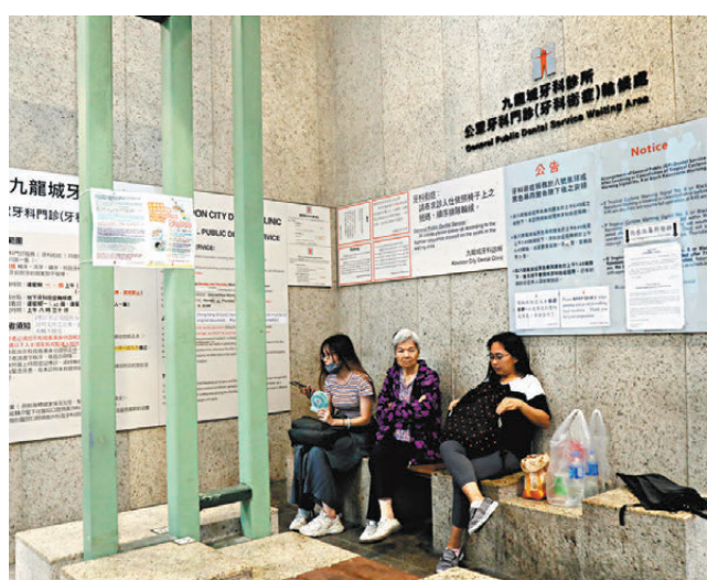
● 衛生署將於本月30日起推出牙科街症網上登記系統，減省市民現場輪候的時間。圖為有市民晚上到九龍城牙科診所排隊輪籌。

香港文匯報訊 衛生署昨日宣布，為進一步便利市民接受牙科街症服務，將於本月30日起推出牙科街症網上登記系統，優化服務流程，減省市民現場輪候的時間。經網上登記並獲發手機短訊通知獲分配牙科街症名額的市民，可於指定時間到指定的牙科診所接受服務。