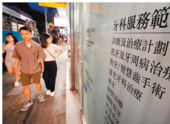
● 衛生署表示，參與青少年護齒共同治理先導計劃的私營牙科機構可自訂收費，但必須公開透明。圖為私營牙科診所。