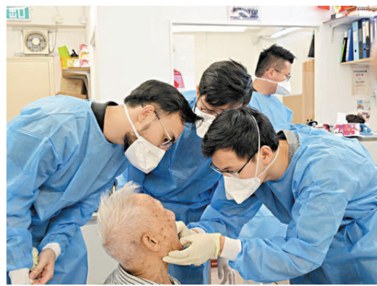
● 「社區牙科支援計劃」將增加補牙服務，包括獲醫管局豁免全部醫療費用的人，政府會資助全數費用。圖為牙醫為長者檢查牙齒。