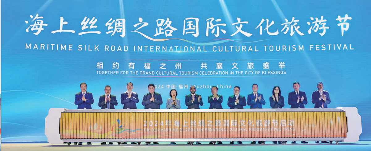
●12月6日，2024年海上絲綢之路國際文化旅遊節啟動儀式在福州隆重舉行。